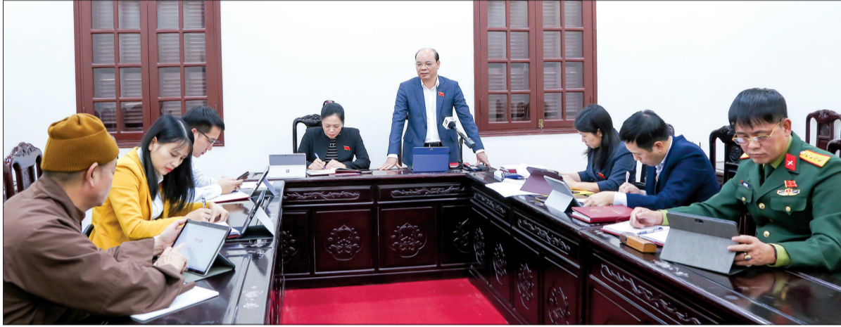
Đồng chí Đặng Thanh Giang, Ủy viên Ban Thường vụ Tỉnh ủy, Phó Chủ tịch thường trực HĐND tỉnh phát biểu tại hội nghị.