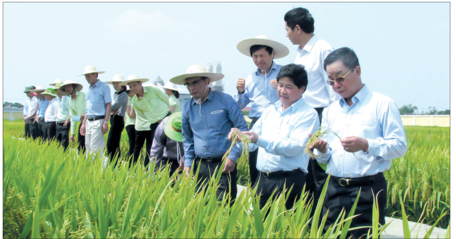
Tham quan khu khảo nghiệm giống lúa của Thai Binh Seed.

Mở đầu câu chuyện, anh bắt đầu từ những khái niệm tưởng như chẳng ăn nhập gì với đề tài tôi đang cần nghe. Vậy mà anh nói có sức hút thật kỳ lạ, đó là chiến lược, là tầm nhìn của người lãnh đạo công ty. Thai Binh Seed có được vị thế như hôm nay là kết quả của một quá trình nỗ lực phấn đấu không mệt mỏi của các thế hệ lãnh đạo và người lao động trong Công ty. Xây dựng Đảng bộ vững mạnh nhiều năm đòi hỏi phải có chiến lược, từ đào tạo cán bộ quản lý, nguồn nhân lực, đến sản xuất kinh doanh. Trong đó, Công ty tập trung xây dựng bộ nhận diện thương hiệu. Đây chính là “chìa khóa” để sản phẩm của Công ty không chỉ đứng vững trên thị trường mà còn chiếm tỷ trọng cao không chỉ ở Thái Bình mà có mặt ở nhiều địa phương trong cả nước. Thai Binh Seed đã thành công khi có bộ nhận diện thương hiệu tiến bộ nhất trong ngành giống cây trồng Việt Nam hiện nay, với những gạo Niêu vàng, A Sào... trong một nhiệm kỳ đại hội tổng lượng hàng hóa bán ra trên 98.000 tấn, vượt 20% mục tiêu đề ra. Tổng doanh thu đạt 2.668 tỷ đồng. Những con số nêu trên chưa nói hết công sức mà Thai Binh Seed đã bỏ ra, từ xây dựng nguồn nhân lực, ứng dụng khoa học công nghệ đến quan hệ hợp tác. Trong