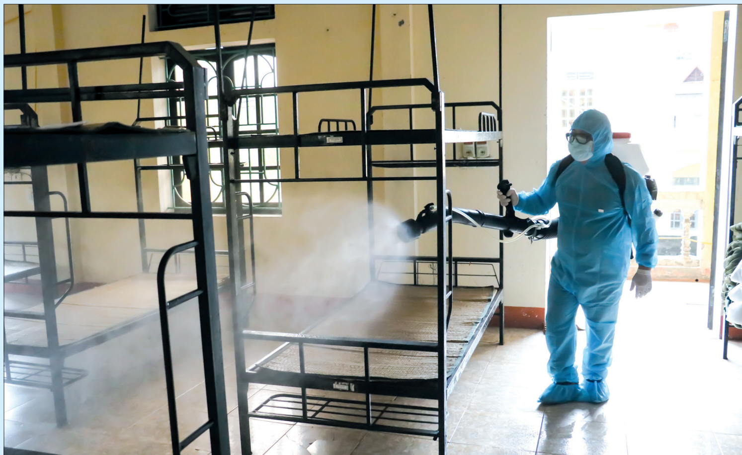
Phun thuốc khử khuẩn tại khu cách ly tập trung, sẵn sàng tiếp nhận người vào cách ly khi có yêu cầu.

Hưng Hà là địa phương đầu tiên của tỉnh có khu dân cư phải phong tỏa do liên quan đến trường hợp bệnh nhân nhiễm Covid-19 tại xã Hòa Tiến. Ban Chỉ đạo phòng, chống dịch của huyện đã chủ động xây dựng các phương án phòng, chống dịch, chuẩn bị đầy đủ vật tư, trang thiết bị y tế và lực lượng tham gia phòng, chống dịch ở địa phương. Thời điểm này, khu cách ly tập trung của huyện tại Trung tâm Bồi dưỡng chính trị huyện đã được vận hành với 10 trường hợp đang được