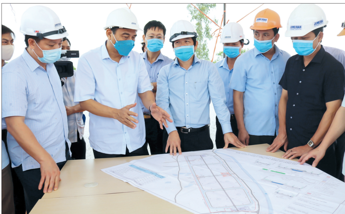
Đồng chí Đặng Trọng Thăng, Phó Bí thư Tỉnh ủy, Chủ tịch UBND tỉnh kiểm tra, động viên nhà đầu tư hạ tầng khu công nghiệp chuyên nông nghiệp Thaco - Thái Bình.

Sáng ngày 15/8, Tập đoàn Thaco chính thức tổ chức động thổ khởi công xây dựng hạ tầng khu công nghiệp chuyên nông nghiệp Thaco - Thái Bình tại huyện Quỳnh Phụ. Các đồng chí: Đặng Trọng Thăng, Phó Bí thư Tỉnh ủy, Chủ tịch