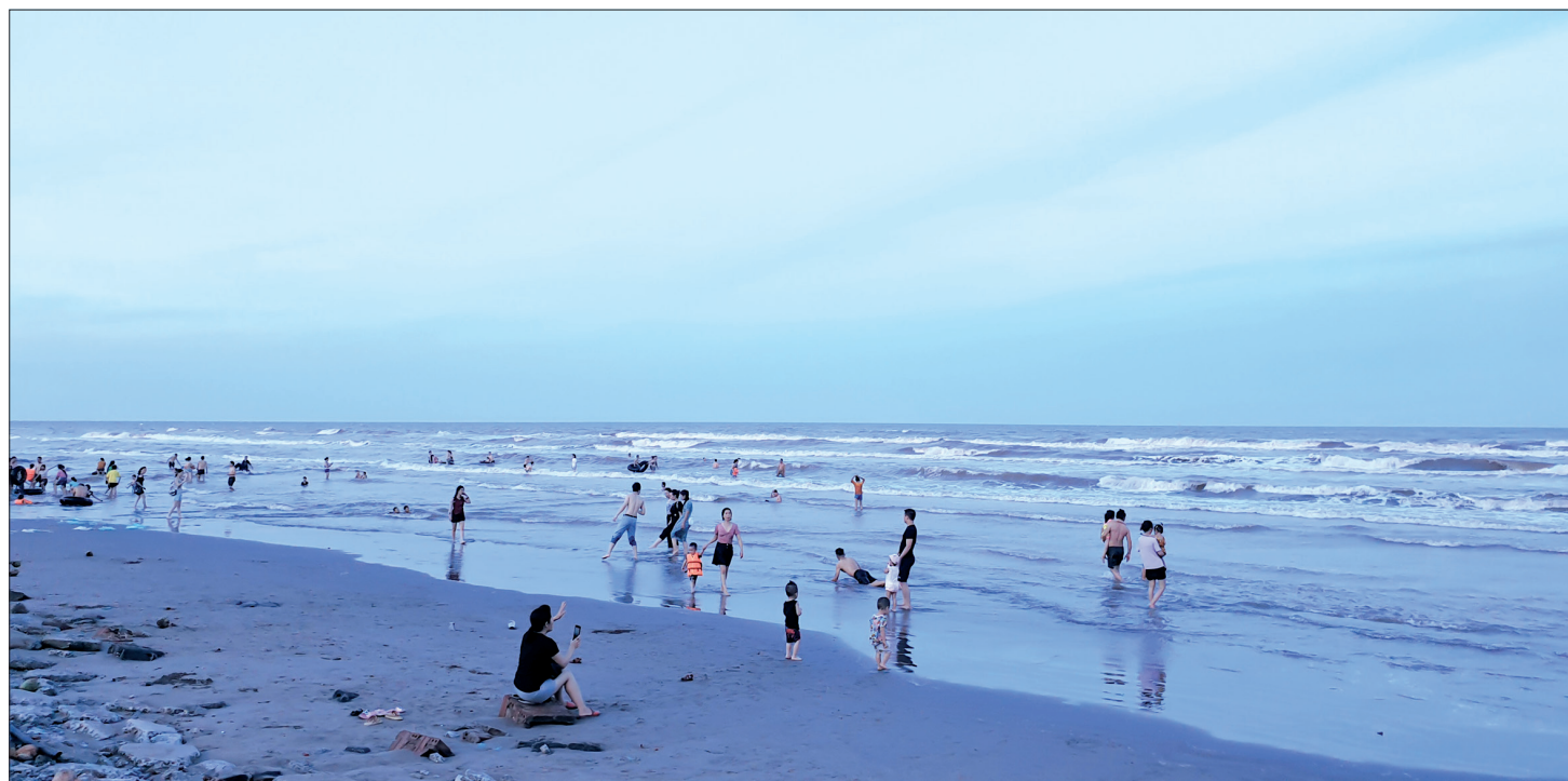
Bãi biển cồn Vành thu hút người dân đến vui chơi, tắm biển vào ngày cuối tuần.

Ngoài bệnh nhân nhiễm Covid-19, 7 trường hợp F1, F2 có liên quan đến bệnh nhân số 566 đang cách ly, theo dõi sức khỏe tại Khoa Truyền nhiễm, Bệnh viện Đa khoa tỉnh đều có kết quả xét nghiệm âm tính lần 2 với SARS-CoV-2. Bên cạnh đó, Bệnh viện cũng đang cách ly, theo dõi sức khỏe 16 trường hợp nghi nhiễm khác. Công tác thu dung, điều trị vẫn đang được thực hiện tích cực với mục tiêu điều trị khỏi cho bệnh nhân nhiễm Covid-19, không để dịch lây chéo sang cán bộ y tế, lây lan ra bệnh viện.