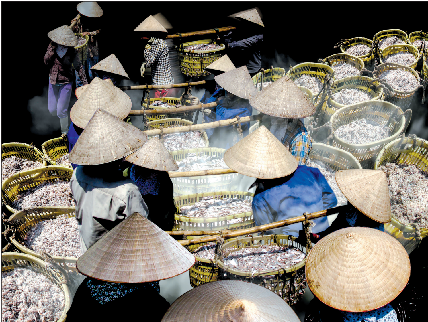
Cá về bến Tân Sơn, thị trấn Diêm Điền (Thái Thụy).