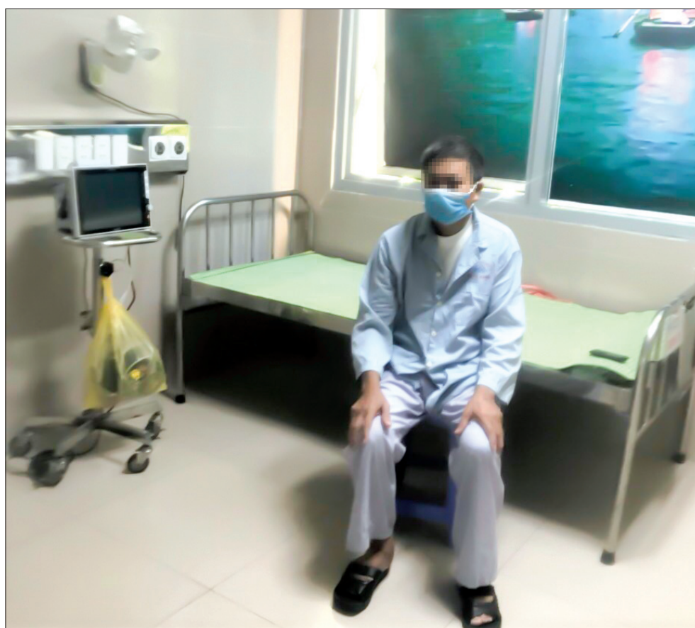
Bệnh nhân số 566 đang điều trị tại Khoa Truyền nhiễm, Bệnh viện Đa khoa tỉnh.