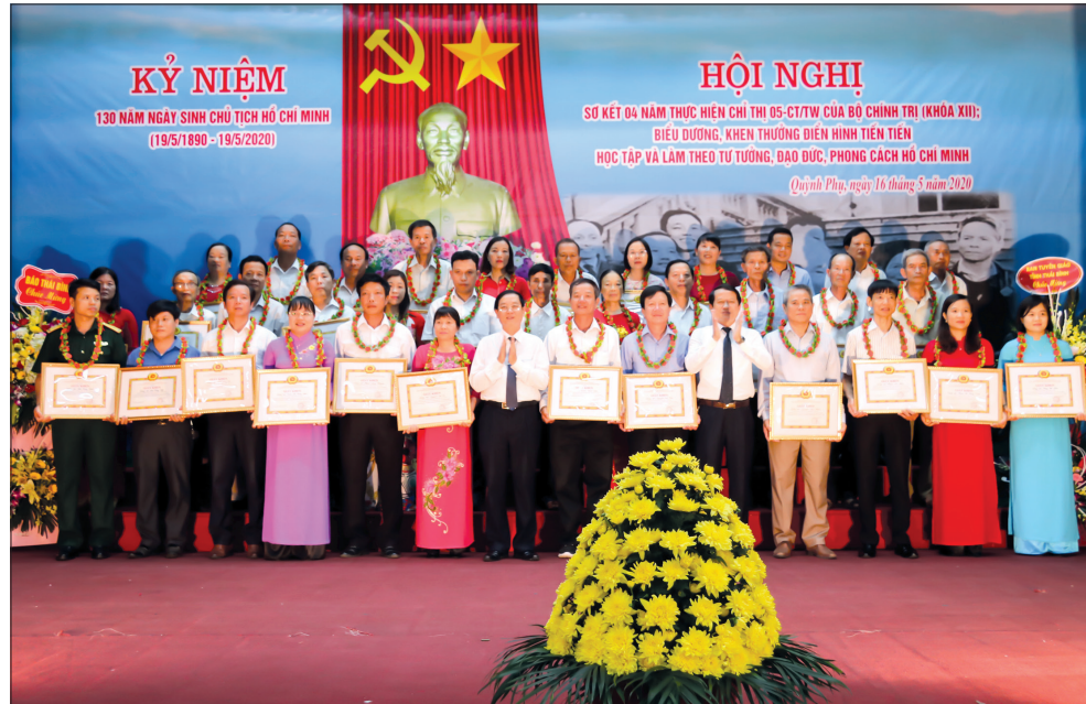
Huyện ủy Quỳnh Phụ khen thưởng các cá nhân có thành tích xuất sắc trong học tập và làm theo tư tưởng, đạo đức, phong cách Hồ Chí Minh giai đoạn 2016 - 2020.

Để cụ thể hóa những nội dung của Chỉ thị số 05, năm 2016 - 2017, Ban Tuyên giáo Tỉnh ủy đã nghiên cứu, bảo vệ thành công đề tài khoa học cấp tỉnh "Nghiên cứu các giải pháp nâng cao hiệu quả học tập và làm theo tư tưởng, đạo đức, phong cách và những lời dạy của Chủ tịch Hồ Chí Minh trong cán bộ, đảng viên, công chức, viên chức và các tầng lớp nhân dân tỉnh Thái Bình". Năm 2018, nghiên cứu đề tài khoa học cấp cơ sở "Các giải pháp nâng cao hiệu quả học tập và làm theo những lời dạy của Chủ tịch Hồ Chí Minh trong một số ngành, giới của tỉnh Thái Bình". Kết quả nghiên cứu được biên soạn, phát hành làm tài liệu chuyên khảo phục vụ công tác tuyên truyền, học tập, rất có giá trị cả về lý luận và thực tiễn.