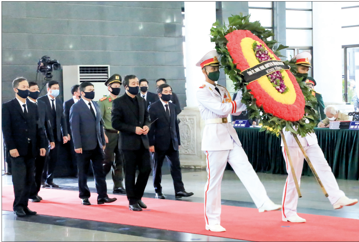
Đoàn đại biểu tỉnh Thái Bình viếng đồng chí Lê Khả Phiêu.