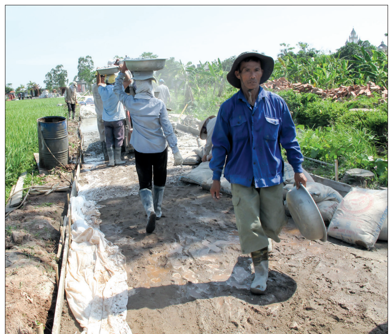
Hội viên, nông dân xã Vũ Đoài (Vũ Thư) tham gia làm đường giao thông nội đồng. Ảnh tư liệu

Thực hiện Chương trình mục tiêu quốc gia xây dựng nông thôn mới (NTM), giai đoạn 2010 - 2019, các cấp hội nông dân huyện Vũ Thư đã vận động cán bộ, hội viên đóng góp 35,7 tỷ đồng, tham gia 38.513 ngày công và có 1.713 hộ gia đình cán bộ, hội viên hiến 49.763m² đất để thực hiện các tiêu chí NTM. Ngoài ra, các cấp hội còn thành lập 167 tổ nông dân tự quản giám sát bảo vệ môi trường; duy trì hiệu quả các hoạt động tham gia giữ gìn vệ sinh môi trường, đường làng, ngõ xóm vào ngày 24, 25 hàng tháng; vận động hội viên xây dựng bể biogas, sử dụng chế phẩm sinh học trong chăn nuôi để giảm ô nhiễm môi trường, bảo đảm môi trường nông thôn mới sáng, xanh, sạch. MINH QUÂN