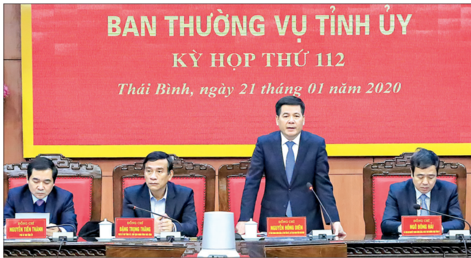
Đồng chí Nguyễn Hồng Diên, Ủy viên Trung ương Đảng, Bí thư Tỉnh ủy, Chủ tịch HĐND tỉnh phát biểu tại hội nghị.