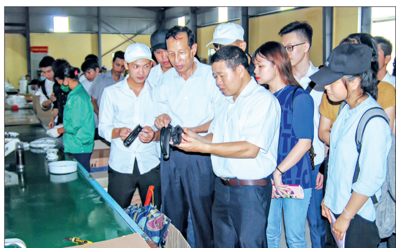
Cán bộ, giảng viên, sinh viên Trường Đại học Thái Bình tham quan thực tế tại Công ty TNHH Điện cơ Aidi (khu công nghiệp Gia Lễ).

Sáng ngày 27/7, Trường Đại học Thái Bình tổ chức cho cán bộ, giảng viên, sinh viên tham quan thực tế tại Công ty TNHH Điện cơ Aidi (khu công nghiệp Gia Lễ).