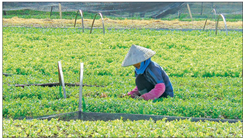
Nông dân xã Vũ Phúc (thành phố Thái Bình) chăm sóc cây màu hè.

kiểm tra tại 4 phường, xã, 32 tổ tiết kiệm và vay vốn, đối chiếu được 378 hộ với tổng số tiền 12,783 tỷ đồng.