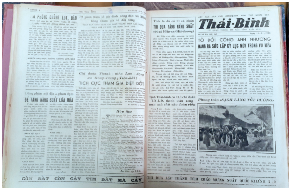
Một tờ Tin Thái Bình xuất bản năm 1958 đã có hình thức 1 tờ báo.

Trong giai đoạn đầu của cách mạng Việt Nam nói chung, cuộc cách mạng trên quê hương Thái Bình nói riêng, những tờ báo cách mạng tại Thái Bình lần lượt ra đời, có tờ chỉ hoạt động trong một thời gian ngắn nhưng báo chí cách mạng tại Thái Bình đã hoàn thành xuất sắc nhiệm vụ truyền bá chủ nghĩa Mác - Lênin, tinh