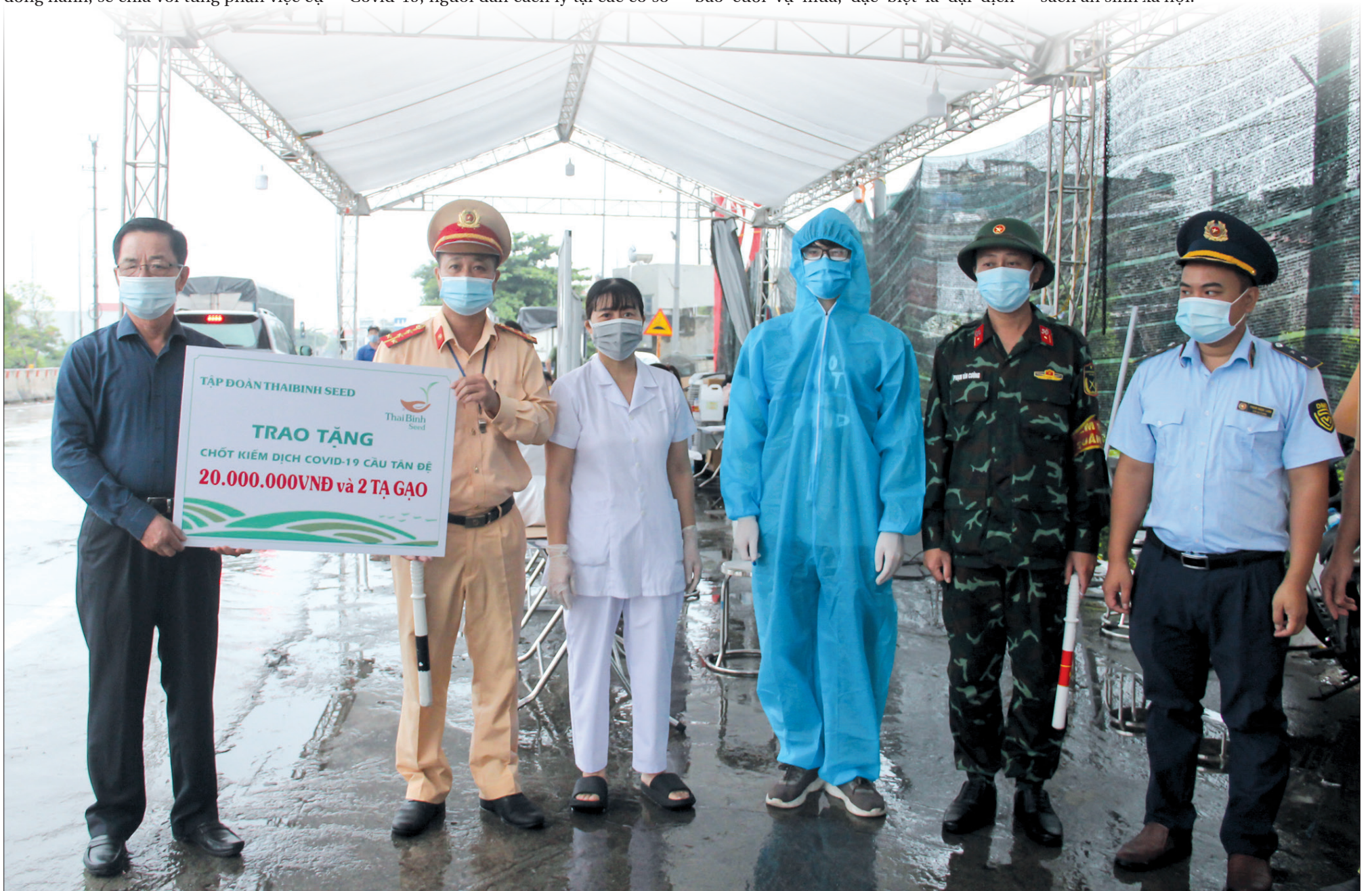
Lãnh đạo TháiBinh Seed tặng quà chốt kiểm soát dịch Covid-19 cầu Tân Đệ, tháng 9/2021.

Song hành cùng sự phát triển của tỉnh, rất cần những doanh nghiệp, doanh nhân có tâm, có tầm, có trách nhiệm với cộng đồng như TháiBinh Seed. Đây là nguồn động viên thiết thực tiếp thêm sức mạnh để các học sinh nghèo, những mảnh đời kém may mắn, các hộ gia đình khó khăn... vươn lên trong cuộc sống; góp phần cùng tỉnh thực hiện tốt chính sách an sinh xã hội.