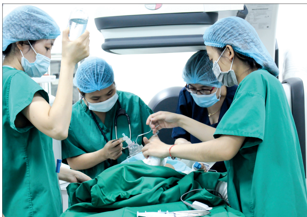
Công tác chuẩn bị trước khi thực hiện kỹ thuật can thiệp tim mạch.

Để triển khai được kỹ thuật can thiệp tim mạch, Bệnh viện Nhi Thái Bình đã chuẩn bị các điều kiện về nhân lực, cơ sở vật chất, trang thiết bị y tế. Cụ thể, Bệnh viện đã cử 2 kíp cán bộ đi đào tạo tại Bệnh viện Nhi Trung ương từ năm 2016 - 2020. Về trang thiết bị y tế, Bệnh viện được dự án phát triển bệnh viện tỉnh, vùng giai đoạn II (dự án JICA) đầu tư hệ thống máy chụp mạch số hóa xóa nền trị giá gần 38 tỷ đồng. Đây là hệ thống chụp hình mạch máu kết hợp giữa chụp X-quang và xử lý số, sử dụng thuật toán để xóa nền trên