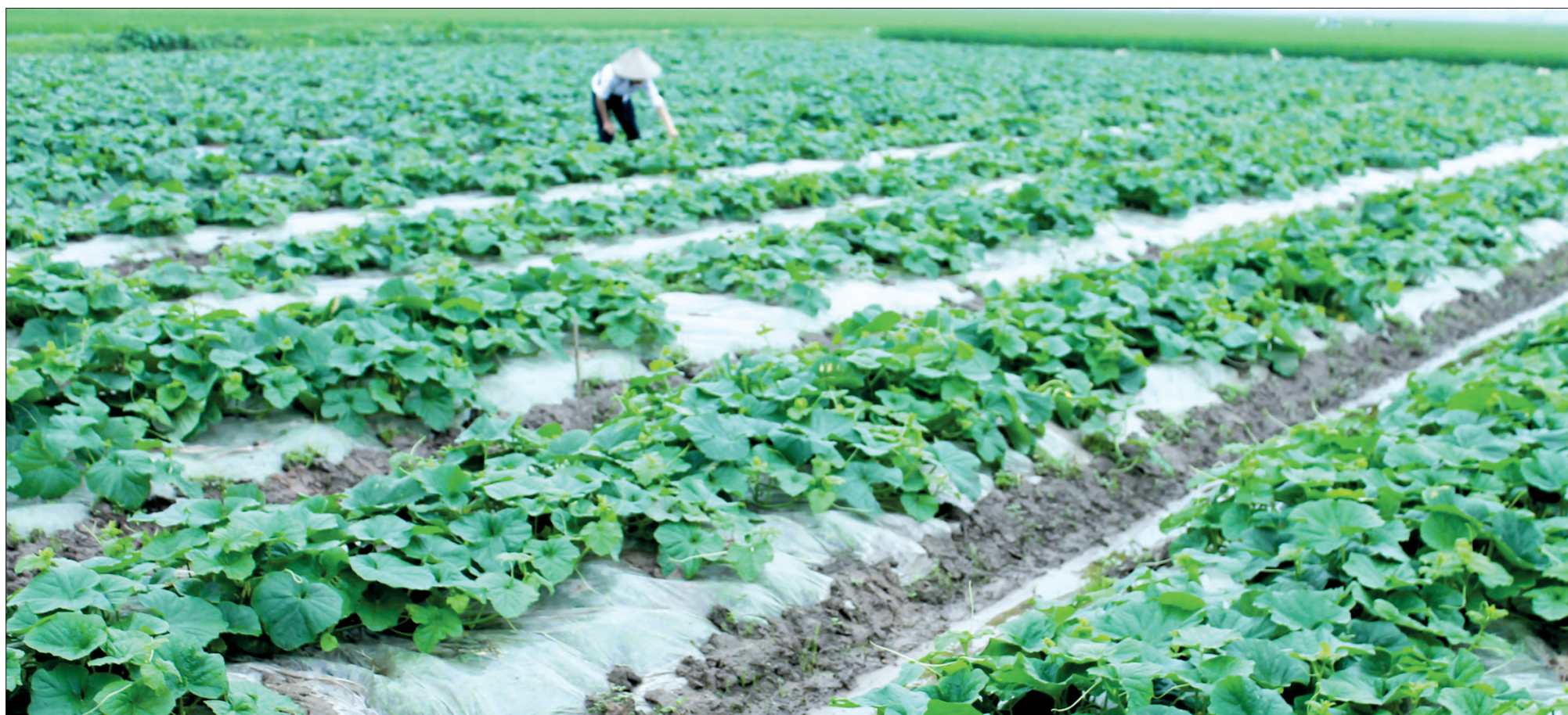
Vẫn là các cánh đồng 5 tấn xưa, nhưng hiện nay xã viên HTX Tân Phong đã đổi mới, hướng đến sản xuất nông nghiệp theo hướng hàng hóa, có giá trị kinh tế cao.

Dẫu thời gian dần xa nhưng những lời chỉ dạy và sự động viên, khích lệ của Bác năm xưa, đến nay cán bộ, xã viên HTX Tân Phong vẫn còn khắc ghi. Mỗi cán bộ, xã viên luôn nỗ lực thi đua lao động sản xuất, phấn đấu xây dựng “HTX Tân Phong sẽ tiến bộ không ngừng và trở nên một HTX kiểu mẫu”, góp phần cùng Đảng bộ và nhân dân trong tỉnh xây dựng Thái Bình sớm trở thành tỉnh gương mẫu về mọi mặt như Bác hằng mong.