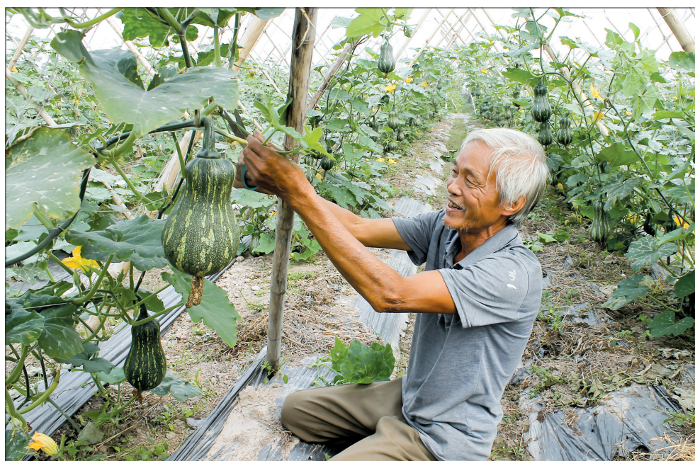
Nông dân HTX Tân Phong (xã Việt Hùng) tích cực đổi mới cơ cấu cây trồng, ứng dụng tiến bộ khoa học kỹ thuật, nâng cao giá trị sản xuất.

Trong cuộc kháng chiến chống Mỹ cứu nước, nhờ thành tích đạt năng suất lúa cao nhất toàn miền Bắc, góp phần đưa Thái Bình trở thành tỉnh đầu tiên của miền Bắc đạt năng suất lúa 5 tấn/ha, HTX Tân Phong, xã Việt Hùng, huyện Thư Trì (Vũ Thư ngày nay) vinh dự 2 lần được Bác Hồ gửi thư khen. Những lời động viên, khích lệ kịp thời của Người là động lực, hành trang để cán bộ, xã viên HTX Tân Phong thi đua lao động sản xuất, dựng xây quê hương trong suốt 55 năm qua.