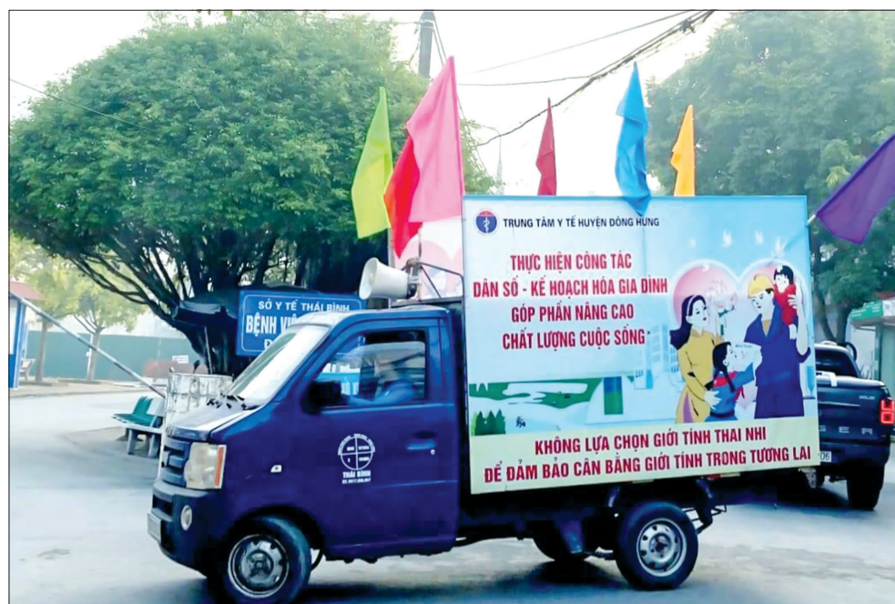
Huyện Đông Hưng tổ chức tuyên truyền lưu động kỷ niệm 60 năm ngày Dân số Việt Nam (26/12/1961 - 26/12/2021).

Giai đoạn 1991 - 2000, đặc biệt từ năm 1993 đến năm 2000, công tác dân số - KHHGD của Thái Bình đã có những bước phát triển vượt bậc. Thực hiện Nghị quyết số 04-NQ/HNTW, ngày 14/1/1993 của Ban Chấp hành Trung ương Đảng khóa VII và Chiến lược dân số - KHHGD Việt Nam đến năm 2000, UBND tỉnh đã xây dựng Chiến lược dân số - KHHGD giai đoạn 1993 - 2000 với mục tiêu: Phấn