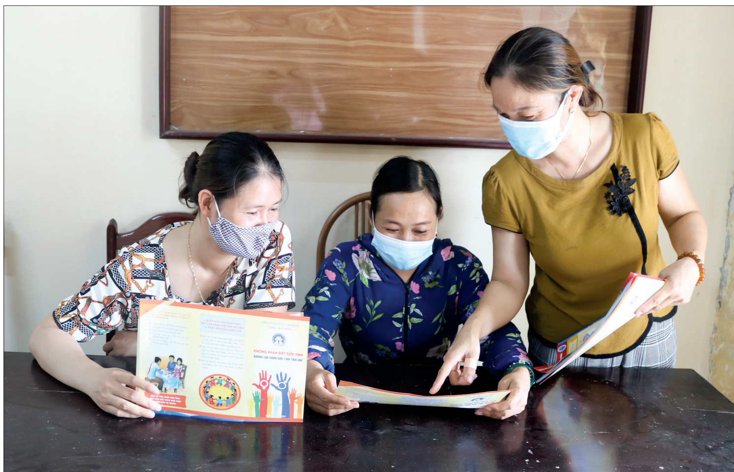
Tư vấn sức khỏe cho người cao tuổi xã Thụy Liên (Thái Thụy).

Dân số là yếu tố quan trọng hàng đầu của sự nghiệp xây dựng và bảo vệ Tổ quốc. Công tác dân số là nhiệm vụ chiến lược, vừa cấp thiết vừa lâu dài; là sự nghiệp của toàn Đảng, toàn dân. Trải qua 60 năm triển khai thực hiện chính sách dân số, Thái Bình luôn là một điểm sáng của cả nước với những kết quả nổi bật.