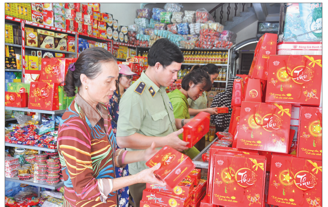
Lực lượng chức năng huyện Thái Thụy kiểm tra hoạt động kinh doanh bánh trung thu trên địa bàn.