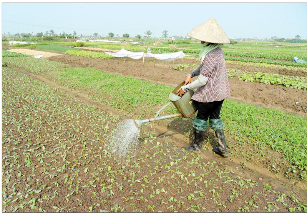
Nông dân xã Vũ Phúc (thành phố Thái Bình) xuống giống vụ rau mới.

Không chỉ cấy lúa, nhiều hộ nông dân ở các xã ven thành phố Thái Bình còn có thu nhập tốt từ trồng rau màu. Nhiều hộ đã thoát nghèo, vươn lên làm giàu.