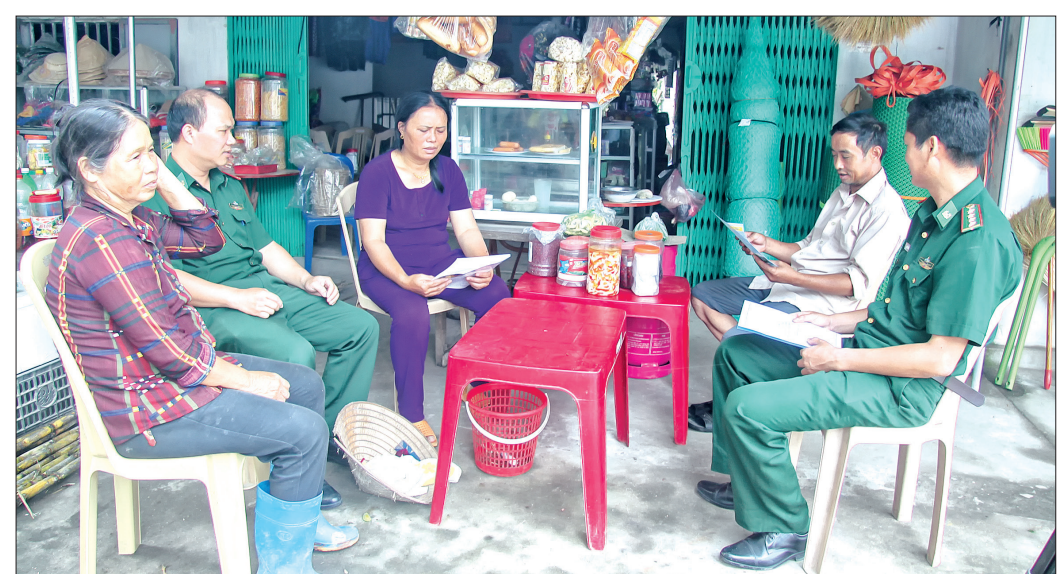
Bộ đội Biên phòng tỉnh tuyên truyền pháp luật cho nhân dân xã Nam Phú (Tiền Hải).