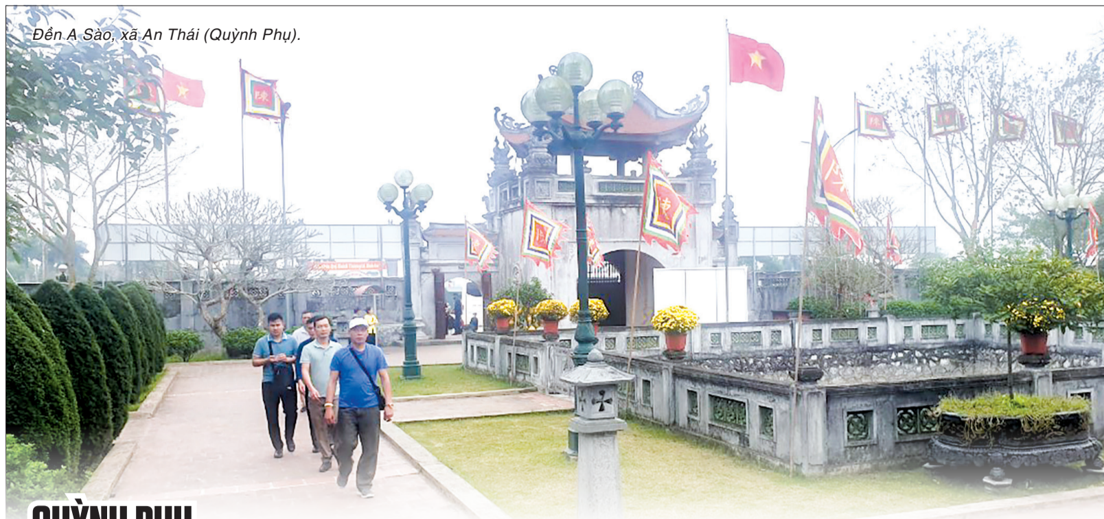
Đền A Sào, xã An Thái (Quỳnh Phụ).