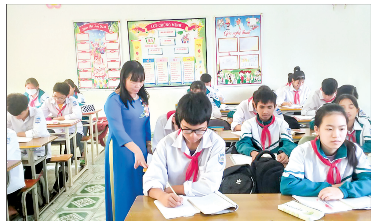
Cô và trò Trường Tiểu học và THCS Thái Phúc (Thái Thụy) vừa học vừa ôn để chuẩn bị cho kỳ thi tuyển sinh vào lớp 10 THPT năm học 2024 - 2025.