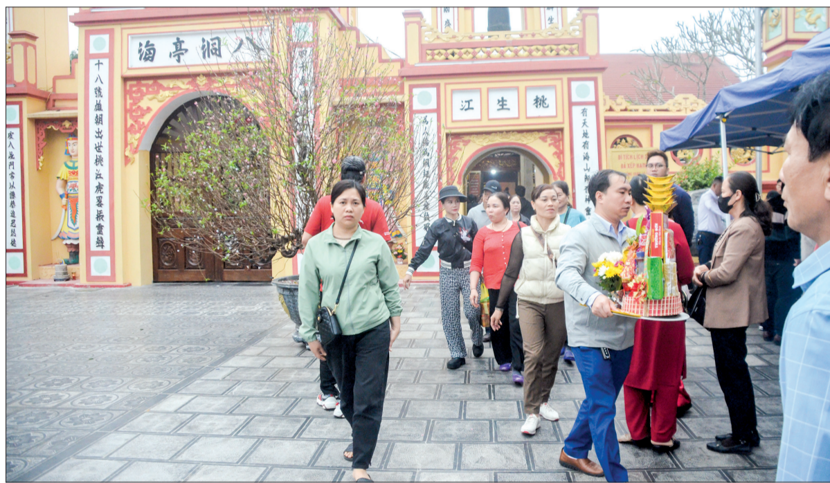
Du khách đến tham quan, chiêm bái đền Đông Bằng, xã An Lễ (Quỳnh Phụ).