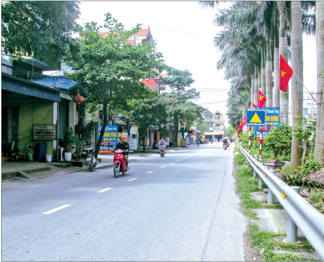
Phong trào xây dựng đời sống văn hóa góp phần đưa thị trấn Hưng Nhân ngày càng phát triển.

Những năm qua, huyện Hưng Hà tập trung tuyên truyền, vận động nhân dân thực hiện toàn diện các cuộc vận động, phong trào thi đua yêu nước, trong đó phong trào "Toàn dân đoàn kết xây dựng đời sống văn hóa" đã đạt được kết quả đáng ghi nhận.