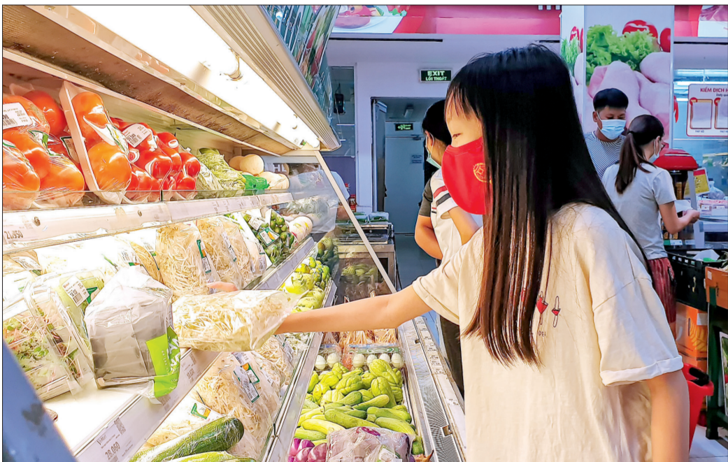
Người dân nâng cao ý thức phòng, chống dịch khi đến nơi công cộng.

Trước diễn biến phức tạp của dịch Covid-19, cùng với cả hệ thống chính trị, người dân các địa phương cũng khởi động lại các hoạt động phòng, chống dịch.