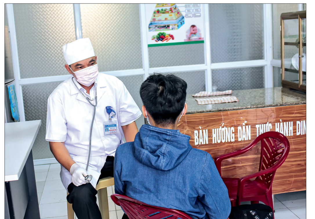
Cán bộ Trung tâm Kiểm soát bệnh tật tỉnh kiểm tra sức khỏe cho người dân từ vùng dịch về có biểu hiện sốt.