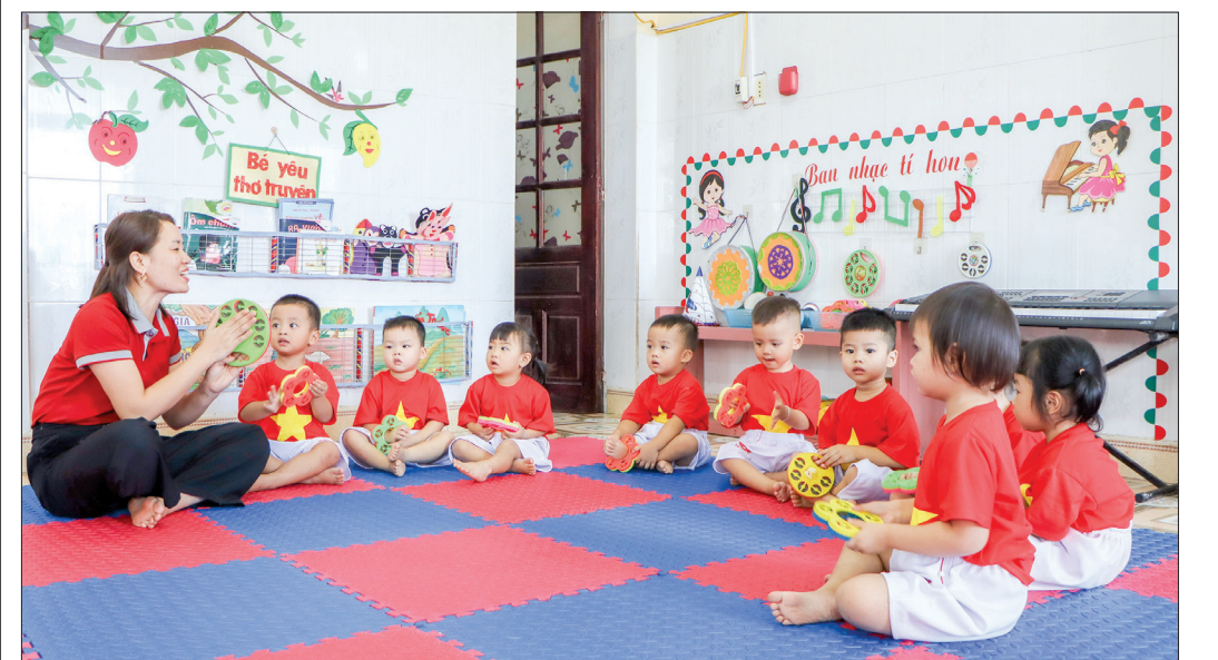
Nhóm lớp từ 24 - 36 tháng của Trường Mầm non Quang Trung (Kiến Xương).

Những ngày này, đi trên các tuyến đường của huyện Tiên Hải, người dân dễ dàng tiếp nhận được thông tin về công tác tuyển chọn, gọi công dân nhập ngũ, thực hiện nghĩa vụ quân sự (NVQS), nghĩa vụ tham gia Công an nhân dân năm 2025. Tiếng loa vang vọng như thúc giục các thanh niên trên miền quê cách mạng háng hái lên đường nhập ngũ.