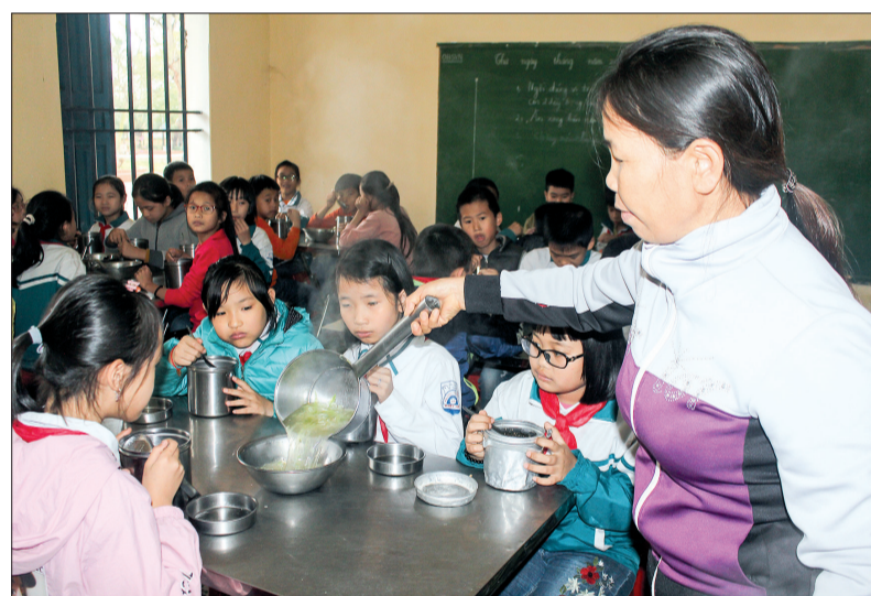
Bữa ăn bán trú của học sinh Trường Tiểu học Thụy Hà (Thái Thụy).