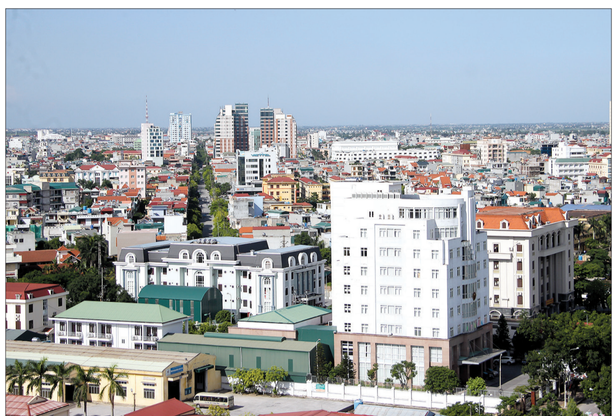
Một góc thành phố Thái Bình.

cũng đã được thực hiện sâu rộng, bằng nhiều hình thức đến toàn thể cán bộ, đảng viên và nhân dân trong tỉnh. Thời gian qua, Cục Thống kê tỉnh đã tổ chức 8 lớp tập huấn tra, từ chuẩn bị xây dựng mạng lưới, thu thập thông tin, kiểm tra và nghiệm thu số liệu, xử lý số liệu đến công bố kết quả tổng điều tra. Trong đó, sử dụng thiết bị di động thu thập thông tin tại các địa bàn điều tra.