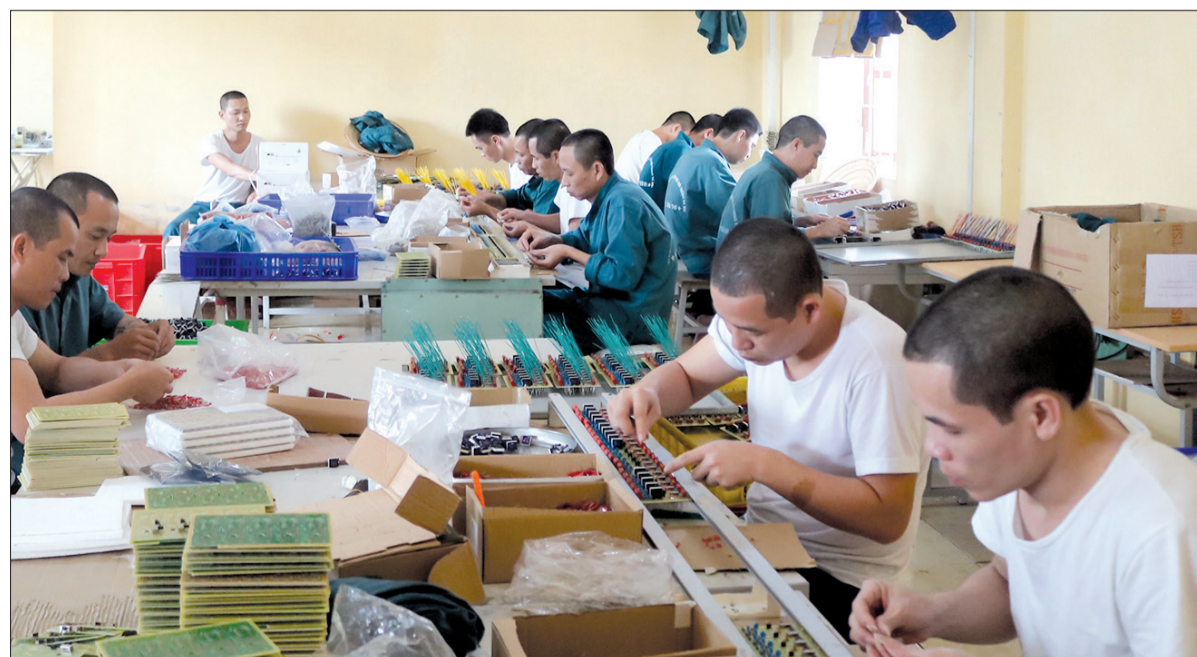
Học viên tại Trung tâm Cai nghiện ma túy và Chăm sóc đối tượng xã hội học nghề gia công điện tử.

túy đối với con người. Sau khi thành lập, các điểm đã thành lập tổ công tác cai nghiện và ban hành nội quy, quy chế hoạt động; tổ chức tư vấn và điều trị cắt cơn cho người nghiện. Theo thống kê, từ khi thành lập đến nay, các điểm đã tổ chức 292 buổi tư vấn nhóm và tư vấn cho cá nhân, tuyên truyền 480 lượt các bài viết về tác hại của ma túy, cơ chế gây nghiện, nguyên nhân dẫn đến nghiện ma túy, hướng dẫn tìm việc làm cho người nghiện sau cai. Tại một số điểm tư vấn, sau thời gian hoạt động bước đầu mang lại hiệu quả, nhiều đối tượng đã cắt được cơn nghiện, học nghề và có việc làm ổn định. Điển hình như điểm cai nghiện tại xã An Vũ (Quỳnh Phụ), dù mới đi vào hoạt động từ tháng 8/2018 nhưng đến nay trong tổng số 37 người nghiện trong xã, các