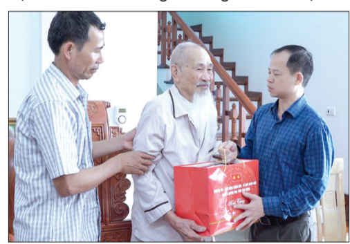
Lãnh đạo huyện Quỳnh Phụ tặng quà cựu chiến binh xã An Quý.

Nhân kỷ niệm 70 năm chiến thắng Điện Biên Phủ (7/5/1954 - 7/5/2024), chiều ngày 24/4, lãnh đạo huyện Quỳnh Phụ đã đến thăm, tặng quà các cựu chiến binh từng tham gia chiến dịch Điện Biên Phủ.