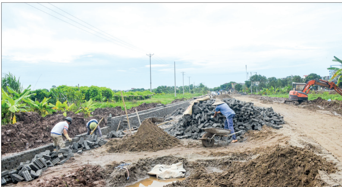
Người dân xã Quỳnh Mỹ (Quỳnh Phụ) hiến đất mở đường tỉnh ĐT.452.