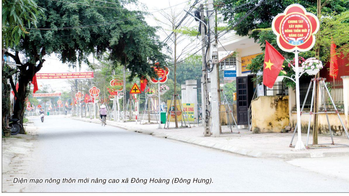
Điện mào nông thôn mới nâng cao xã Đông Hoàng (Đông Hưng).

chưa có giải pháp căn cơ, triệt để nhưng cũng đã được cải thiện. Các đơn vị cấp nước tăng cường bơm cấp luân phiên cho các vùng xa công trình đầu mối. Tuy nhiên, để giải quyết các vướng mắc một cách đồng bộ, căn cơ, Sở Nông nghiệp và Phát triển nông thôn đề nghị UBND, UBND tỉnh chỉ đạo xây dựng các hồ trữ tại các vùng bán âm, bán dương để khắc phục tình trạng nhiễm mặn nguồn nước tại các xã: Thụy Quỳnh (Thái Thụy), Bình Thanh, Thượng Hiền (Kiến Xương) vì những khu vực này đã có đất xây dựng nhưng còn vướng về thủ tục đất đai. Trạm cấp nước xã Vũ Bình (Kiến Xương) nằm trong diện giải phóng mặt bằng để xây dựng tuyến đường cao tốc CT.08, hiện đang chờ bố trí quỹ đất để đầu tư xây dựng ra vị trí mới. Khi xây dựng lại, Sở Nông nghiệp và Phát triển nông thôn sẽ phối hợp cùng công ty để xuất phương án cấp nước cho vùng xa. Đối với trạm cấp nước xã Hồng Minh (Hưng Hà), công ty đã gửi hồ sơ điều chỉnh chủ trương đầu tư, xây dựng phương án cấp nước cho vùng Độc Lập, tuy nhiên vẫn chưa phê duyệt thủ tục hồ sơ. Đối với nguồn nước nhiễm mặn qua các cửa cống lớn như nhà máy nước Thanh Bình, thi trấn Diêm Điền (Thái Thụy), Sở đã trực tiếp trao đổi với công ty về