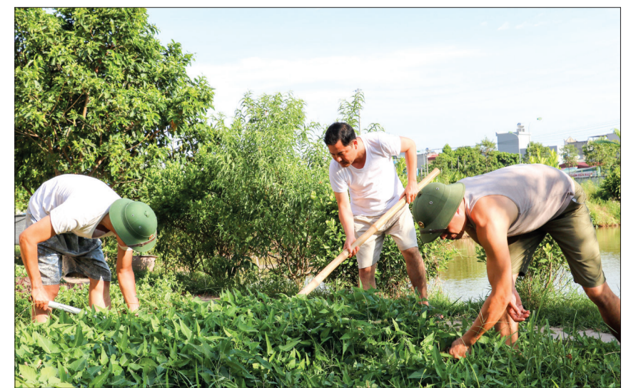
Cán bộ, chiến sĩ Ban CHQS thành phố tăng gia sản xuất tại đơn vị.