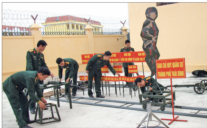
Cán bộ, chiến sĩ Ban CHQS thành phố chuẩn bị mô hình học cụ phục vụ huấn luyện.