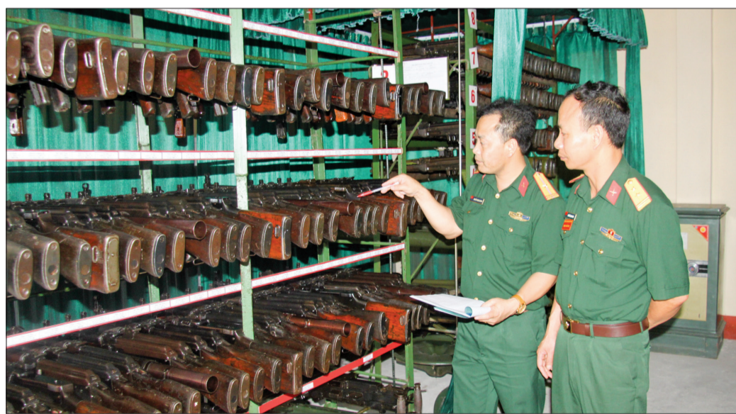
Ban CHQS thành phố làm tốt công tác bảo quản vũ khí trang bị kỹ thuật.