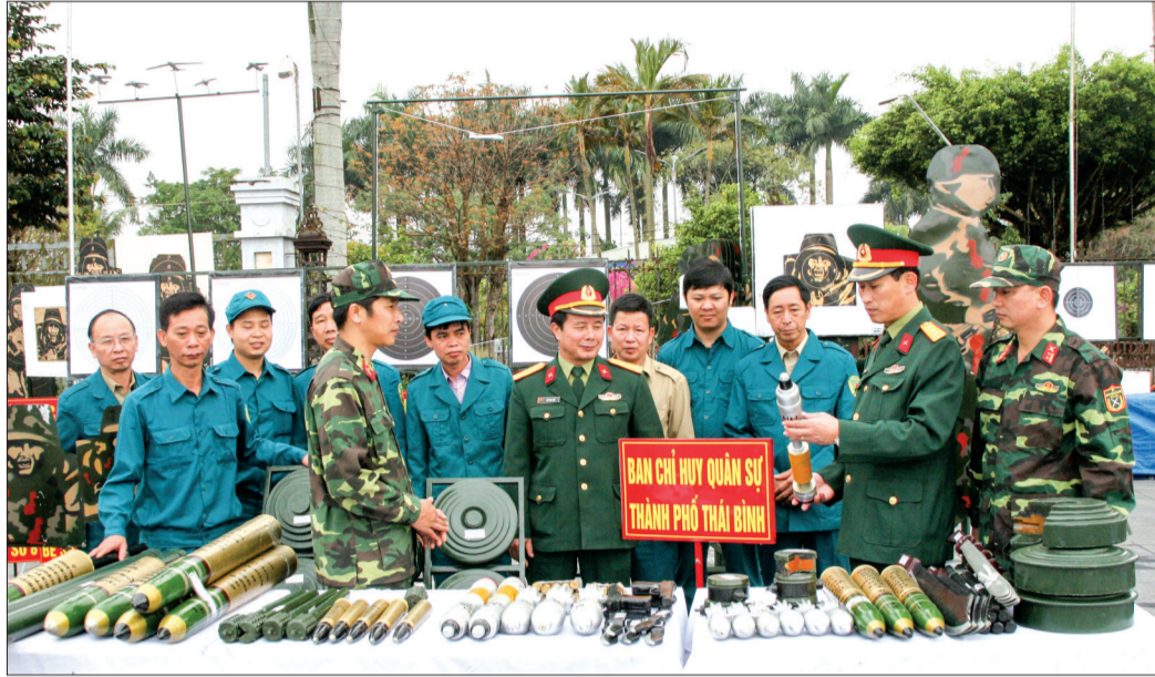
Gian trưng bày mô hình học cụ phục vụ huấn luyện của Ban CHQS thành phố Thái Bình.

Thực hiện các biện pháp xây dựng LLVT địa phương đáp ứng yêu cầu nhiệm vụ, Ban CHQS thành phố đã phối hợp với các ngành và địa phương thực hiện sắp xếp tổ chức biên chế, xây dựng lực lượng theo đúng hướng dẫn.