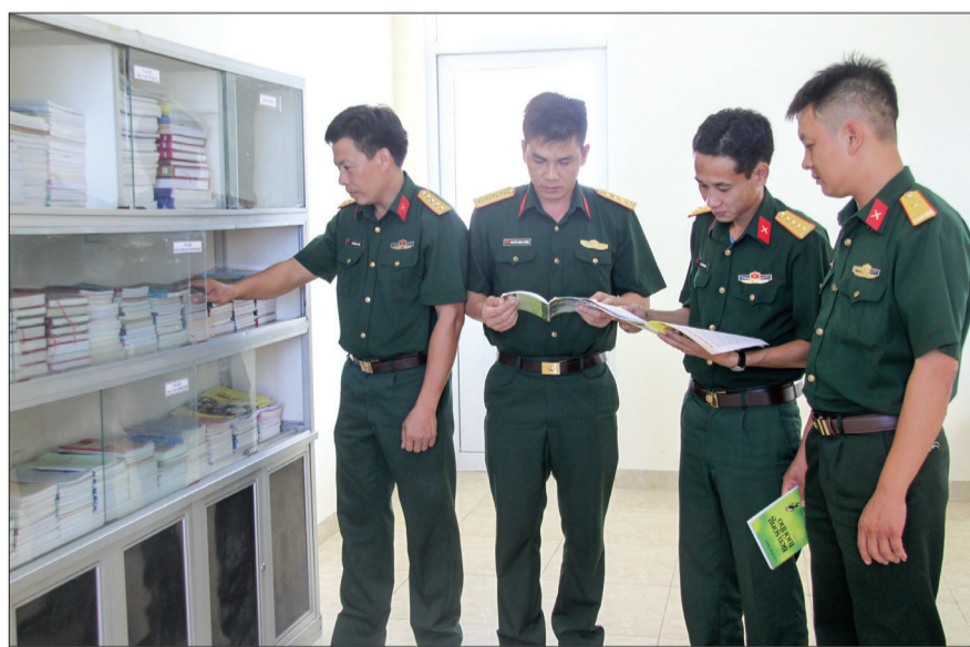
Cán bộ, chiến sĩ Ban CHQS thành phố xây dựng tủ sách pháp luật tại đơn vị.