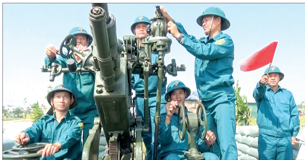
Lực lượng vũ trang thành phố tham gia diễn tập khu vực phòng thủ thành phố năm 2019.