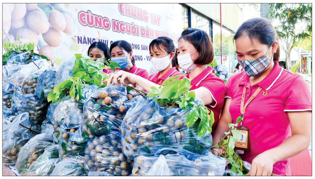
Đoàn viên, thanh niên Công ty Tân Đệ ủng hộ nông dân tỉnh Hưng Yên tiêu thụ nông sản.