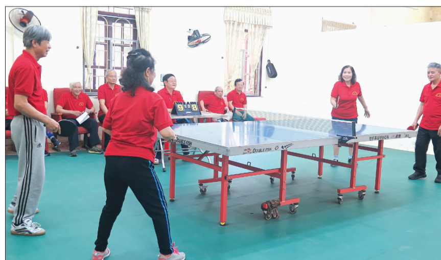
Hội viên luyện tập bóng bàn.