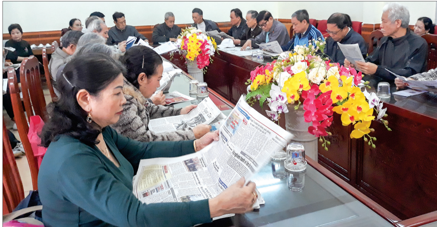
Hội viên Câu lạc bộ Lê Quý Đôn thường xuyên đọc báo Đảng.

Sau giải phóng miền Nam, thống nhất đất nước, nhiều đồng chí cán bộ lão thành cách mạng, cán bộ tiền khởi nghĩa, cán bộ chủ chốt của tỉnh, của lực lượng vũ trang nhân dân nghỉ hưu trên địa bàn thị xã Thái Bình (nay là thành phố Thái Bình) mong muốn có một tổ chức để trao đổi thông tin, giao lưu văn hóa, thể thao, nâng cao đời sống tinh thần, tiếp tục đóng góp công sức, kinh nghiệm xây dựng quê hương, đất nước. Đáp ứng nguyện vọng chính đáng đó, ngày 27/3/1976, Câu lạc bộ (CLB) sức khỏe ngoài trời được thành lập. Ngày 1/7/1989, Ban Thường vụ Tỉnh ủy có Thông báo số 47-TB/TU và UBND tỉnh có Quyết định số 214/QĐ-UBND về việc thành lập CLB sức khỏe Thái Bình. Từ vị trí, vai trò và thực tiễn hoạt động của CLB trong đời sống xã hội, ngày 25/9/1999, Ban Thường vụ Tỉnh ủy có Thông báo số 68-TB/TU, UBND tỉnh có Quyết định số 1251/1999/QĐ-UB đổi tên CLB sức khỏe Thái Bình thành CLB Lê Quý Đôn tỉnh Thái Bình. CLB hoạt động theo nguyên tắc tự nguyện, tự quản, có con dấu, tài khoản và hội số riêng, bảo đảm tuân thủ pháp luật và điều lệ CLB được UBND tỉnh phê duyệt.