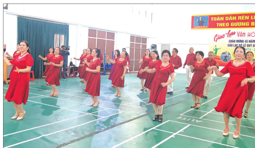
Bộ môn khiêu vũ thể thao thu hút 40 hội viên tham gia.