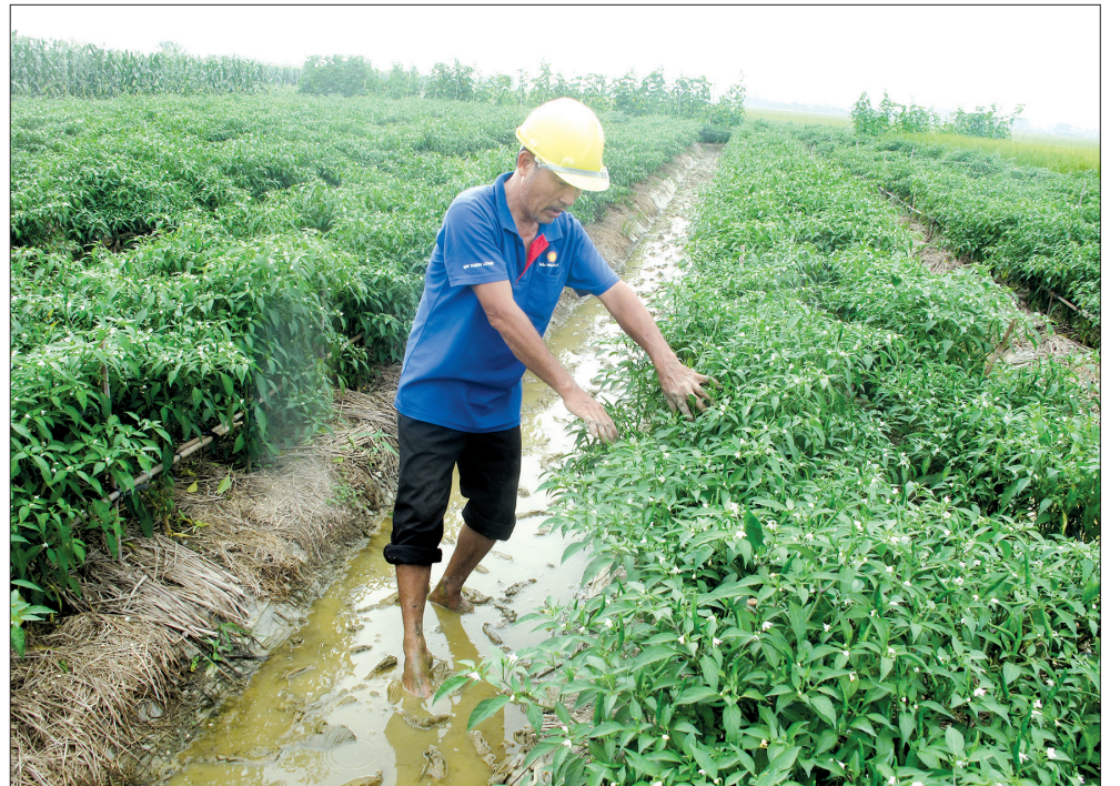
Nông dân xã Quỳnh Hoàng (Quỳnh Phụ) chăm sóc cây ươm.

Để khắc phục tình trạng thiếu hụt lao động trong sản xuất nông nghiệp, giải pháp tối ưu là đẩy mạnh tiến độ cơ giới hóa nhằm giảm công lao động thủ công. Những năm qua, UBND tỉnh đã chỉ đạo các địa phương đẩy mạnh chương trình xây dựng nông thôn mới, dồn điền đổi thửa kết hợp chỉnh trang đồng ruộng, đầu tư phát triển hạ tầng nông thôn, tạo thuận lợi cho việc cơ giới hóa, ứng dụng tiến bộ khoa học kỹ thuật vào sản xuất. Chính sách hỗ trợ kinh phí mua máy và thiết bị phục vụ sản xuất nông nghiệp thời gian qua đã tác động mạnh mẽ đến sản xuất nông nghiệp, góp phần tích cực nâng cao giá trị hàng hóa nông sản, nâng cao lợi nhuận trên một đơn vị diện tích. Đến nay, các khâu làm đất, tưới nước, thu hoạch đạt tỷ lệ gần 100%. Toàn tỉnh có khoảng 5.000 máy làm đất các loại, trên 1.500 máy gặt, 154 máy cấy lúa. Các khâu gặt giảm từ 2,1 - 2,7 triệu đồng/ha, khâu làm đất giảm từ 1,2 - 2,1 triệu đồng/