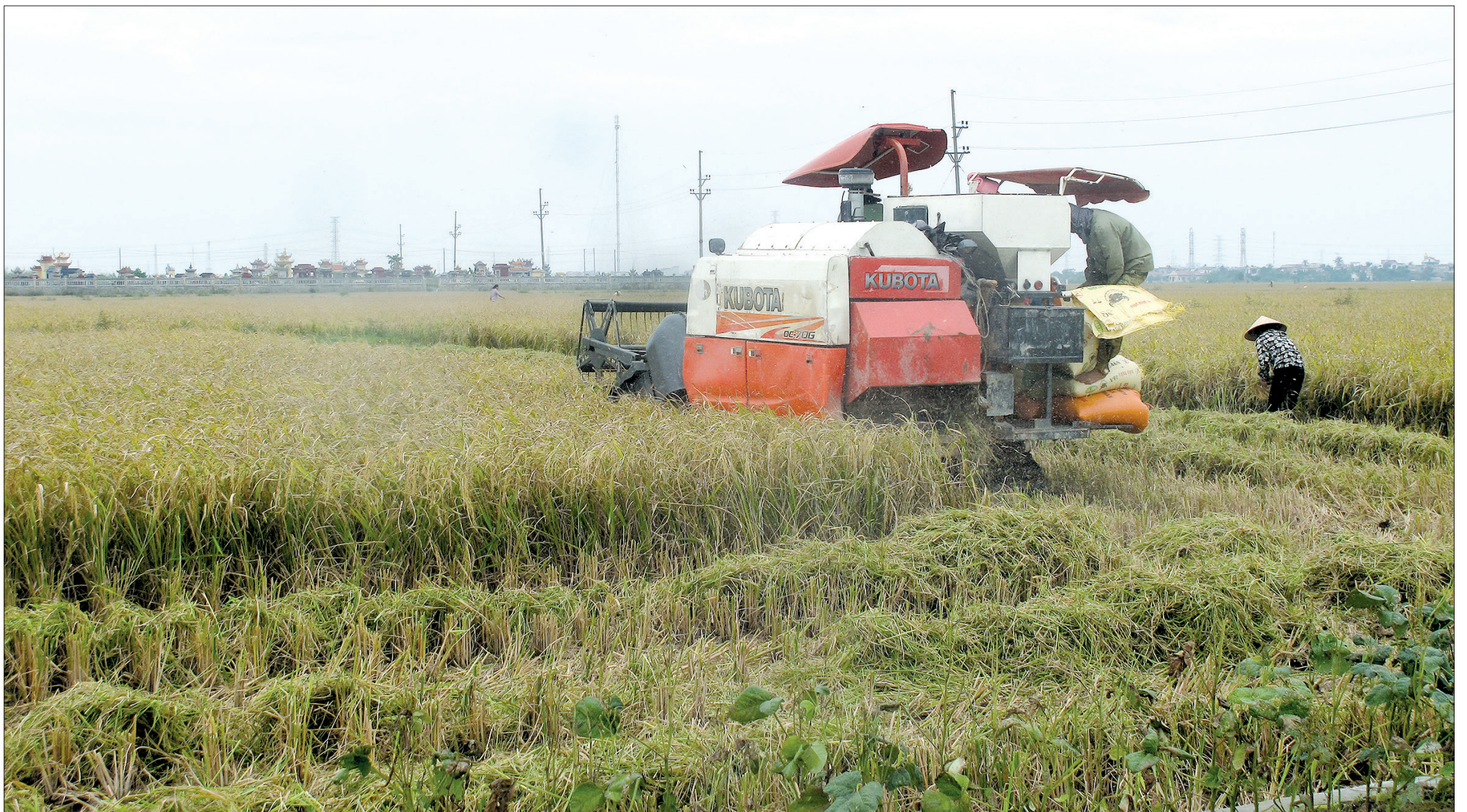
Cơ giới hóa góp phần khắc phục tình trạng thiếu hụt lao động trong nông nghiệp.

Thiếu hụt lao động trong sản xuất nông nghiệp phản ánh xu thế chuyển dịch của nền kinh tế, đặt ra yêu cầu ngành Nông nghiệp cần có bước đi dài hơi không chỉ khắc phục tình trạng này mà còn hướng tới hiệu quả cao, bền vững.