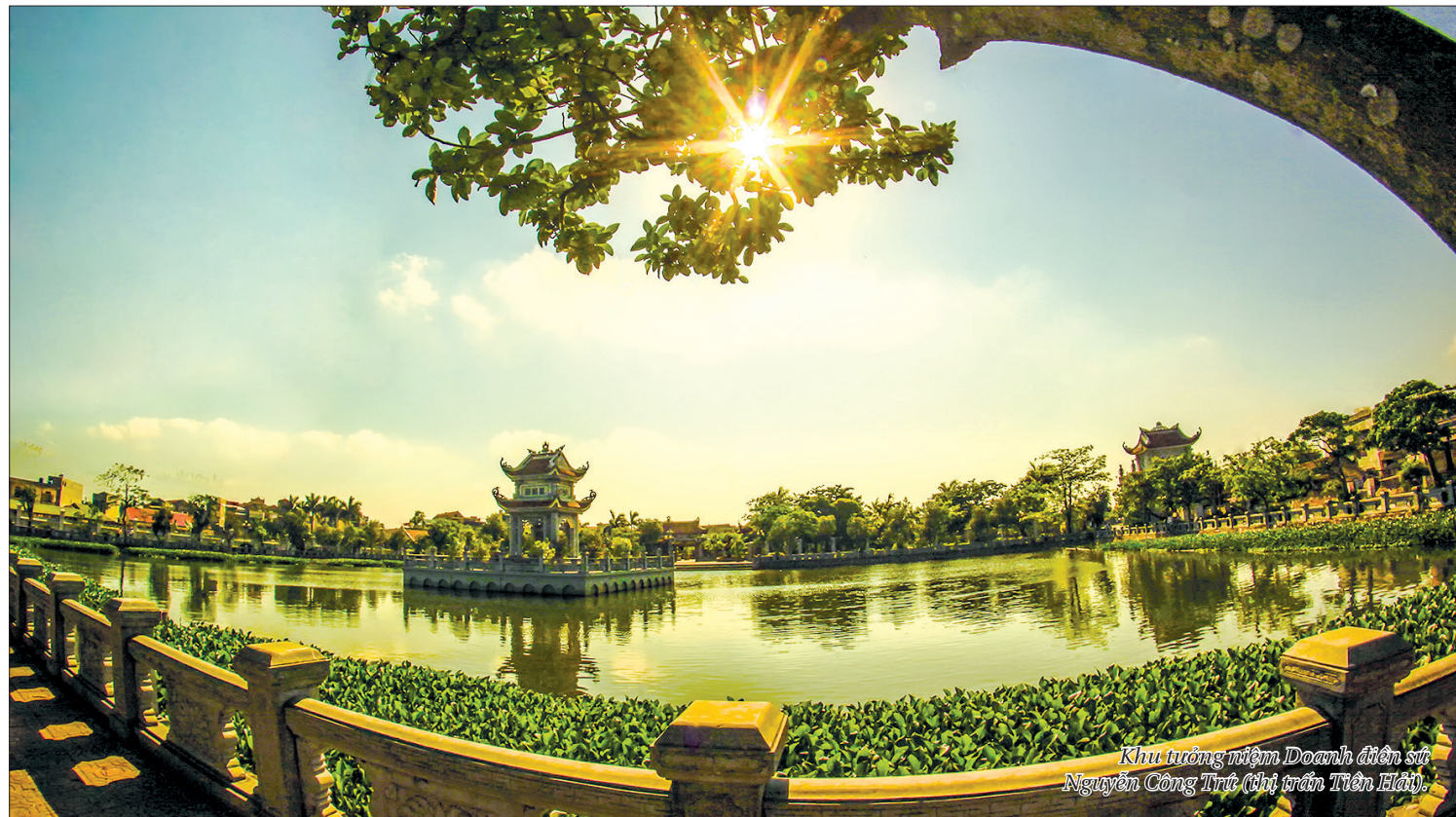
Khu tưởng niệm Doanh điền sứ Nguyễn Công Trứ (thị trấn Tiên Hải).