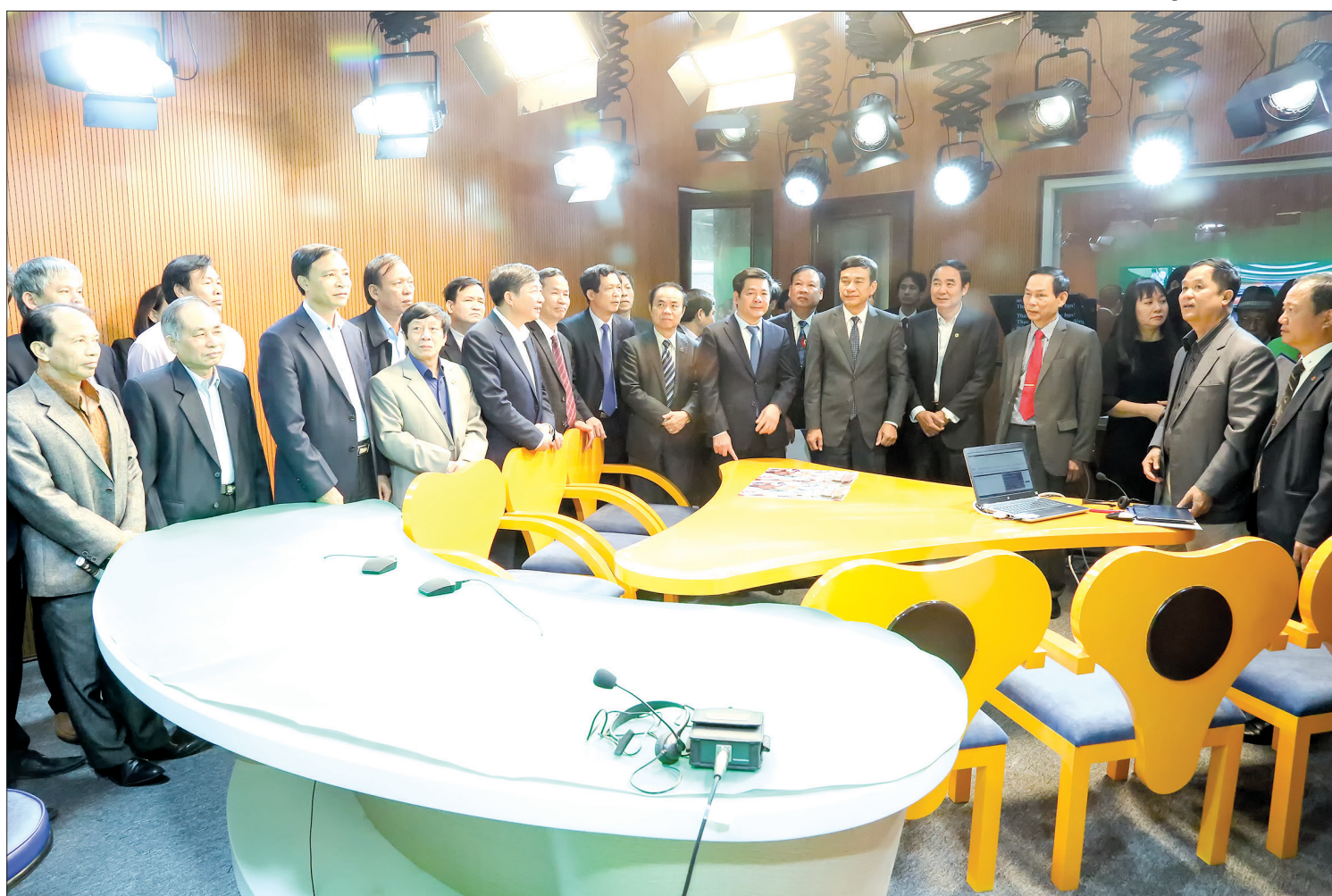
Các đồng chí lãnh đạo tỉnh và Trung ương Hội Nhà báo Việt Nam tham quan trường quay của Báo Thái Bình điện tử.