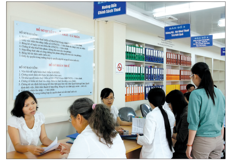
Tổ chức tin dụng vi phạm hành chính thuế có thể bị phạt tiền từ 800.000 đồng đến 2 triệu đồng.

và cưỡng chế thi hành quyết định hành chính thuế, các TCTD sẽ bị phạt tiền từ 800.000 đồng đến 2 triệu đồng nếu cung cấp không đầy đủ, không chính xác các thông tin, tài liệu, chứng từ, hóa đơn, sổ kế toán liên quan đến việc xác định nghĩa vụ thuế trong thời hạn kê khai thuế; không cung cấp, cung cấp không đầy đủ, không chính xác các thông tin, tài liệu liên quan đến tài khoản tiền gửi tại TCTD, Kho bạc Nhà nước, công nợ bên thứ ba có liên quan; không thực hiện trách nhiệm trích chuyển tiền từ tài khoản của người nộp thuế vào ngân sách nhà nước đối với số tiền thuế, tiền chậm nộp thuế, tiền phạt, tiền chậm nộp tiền phạt phải nộp của người nộp thuế. Chính vì thế, để thực hiện nghiêm quy định của Luật Quản lý thuế, giảm bớt nợ đọng thuế và tăng thu cho ngân sách nhà nước, thời gian tới, các TCTD trên địa bàn tỉnh chủ động phối hợp với cơ quan thuế các cấp trong việc cung cấp thông tin về tài khoản của người nộp thuế mở tại đơn vị, trên cơ sở đó cơ quan thuế sẽ sử dụng biện pháp cưỡng chế phù hợp đối với các đơn vị còn nợ thuế; đồng thời thông báo cho cơ quan thuế bằng văn bản kết quả thực hiện các quyết định cưỡng chế vào ngày cuối cùng trong tháng (có nêu rõ lý do trường hợp không thực hiện trích tiền).