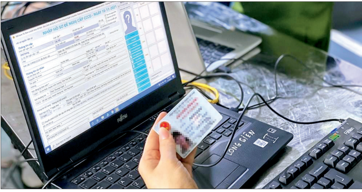
Thuê bao di động mới phải xác thực trong Cơ sở dữ liệu quốc gia về dân cư.