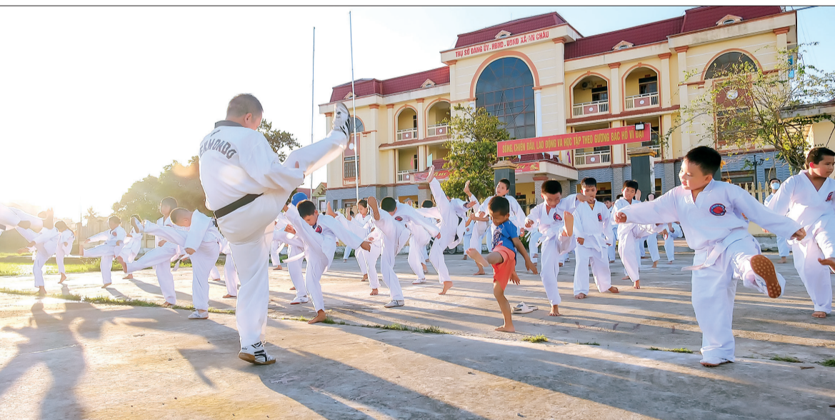
Một buổi tập của thầy và trò lớp taekwondo, xã An Châu (Đông Hưng).

Trước đây, việc tham gia sân chơi trong dịp hè của thiếu niên, nhi đồng tại các vùng nông thôn của huyện Đông Hưng còn hạn chế. Thế nhưng, những năm gần đây, khi các địa phương về đích nông thôn mới, đời sống vật chất, tinh thần của nhân dân ngày càng được nâng cao, những sân chơi trong dịp hè đây bố ích dành cho trẻ em như lớp dạy võ, dạy bơi, học múa hát... đã được tổ chức rộng rãi, mang lại hiệu quả tích cực.