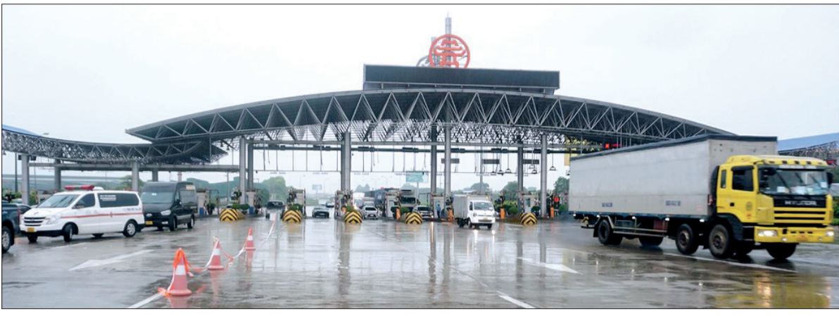
Từ ngày 1/8, các tuyến cao tốc áp dụng thu phí không dừng ETC.