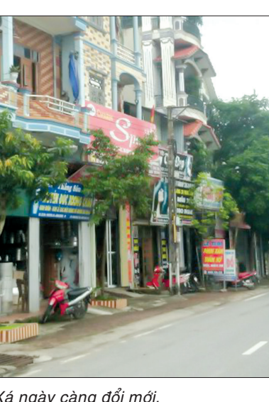
Nguyễn Xá ngày càng đổi mới.