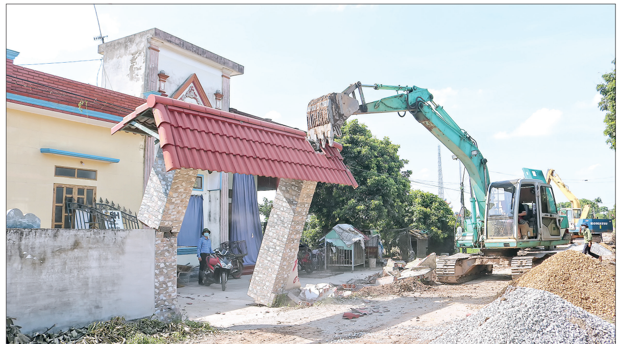
Người dân xã Quỳnh Ngọc (Quỳnh Phụ) tháo dỡ công trình, tự nguyện hiến đất làm đường.