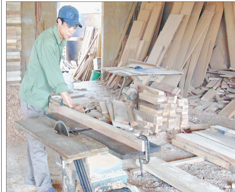
Cơ sở sản xuất đồ mộc Quý Tuyền (thôn Cổ Dưng 2) duy trì sản xuất nhờ nguồn vốn vay của Quỹ TDND Đông La (Đông Hưng).

Được thành lập từ tháng 4/2007 với số thành viên ban đầu 40 người, đến nay, Quỹ Tín dụng nhân dân (TDND) Đông La (Đông Hưng) đã không ngừng phát triển với gần 1.100 thành viên. Trong điều kiện hoạt động còn gặp nhiều khó khăn nhưng Quỹ luôn triển khai đồng bộ nhiều giải pháp, từ đó nâng cao chất lượng và hiệu quả hoạt động.