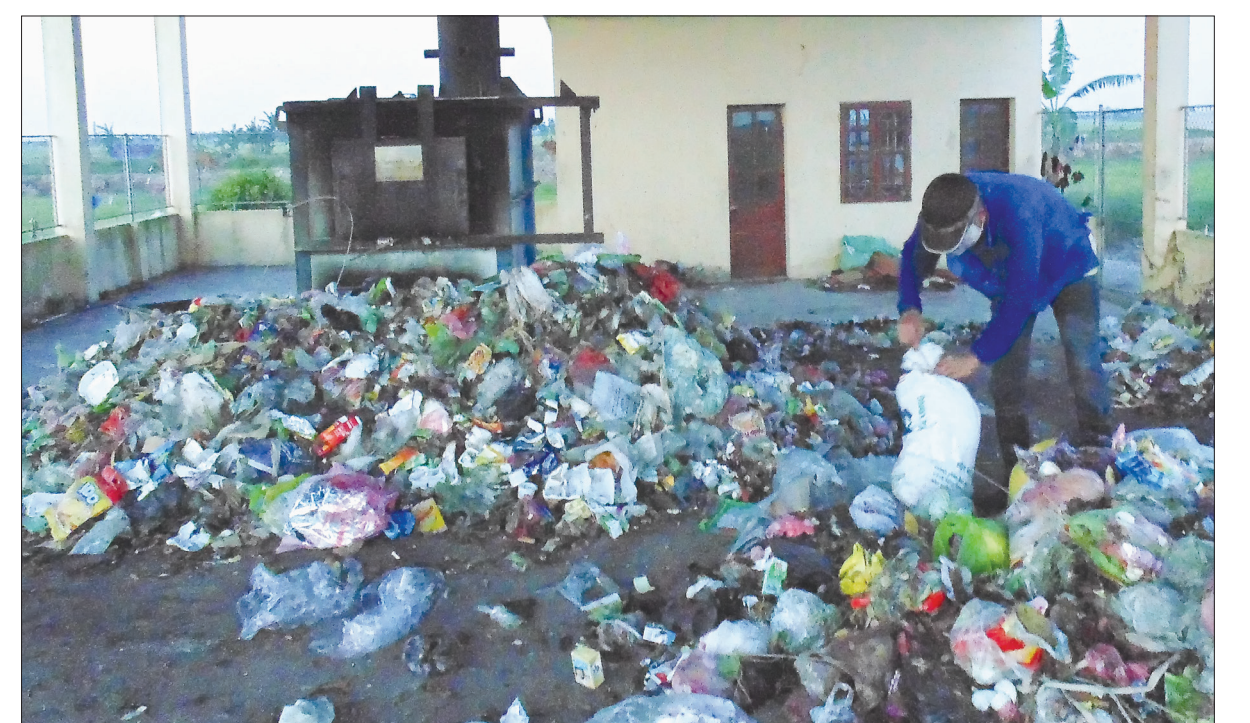
Công nhân khu xử lý rác thải thị trấn Thanh Nê (Kiến Xương) phân loại rác trước khi đưa vào lò đốt.