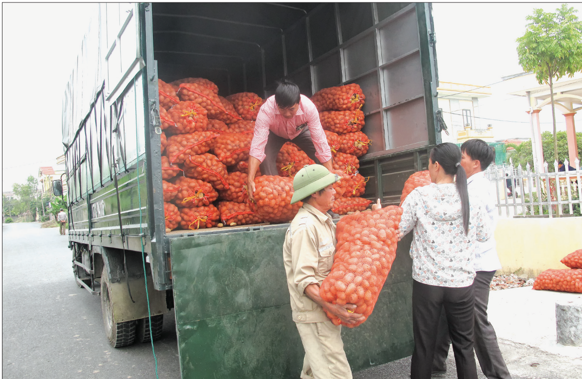
Xã Bình Minh (Kiến Xương) tiếp nhận khoai tây giống hỗ trợ của tỉnh.

Thời điểm này, các địa phương cơ bản đã tiếp nhận đủ khoai tây giống hỗ trợ của tỉnh. Khoai tây giống về đến đâu bà con trồng đến đó, tranh thủ thời tiết thuận lợi để hoàn thành kế hoạch sản xuất trong khung thời vụ tốt nhất.