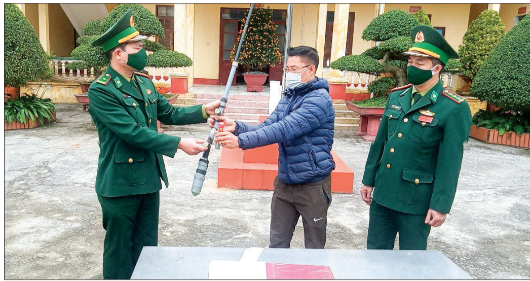
Bộ đội Biên phòng tuyên truyền, vận động người dân xã Thái Thượng tự giác giao nộp vũ khí tự chế và pháo.

Thái Thượng là xã ven biển có vị trí quan trọng về kinh tế - xã hội, quốc phòng, an ninh của huyện Thái Thụy nói riêng, tỉnh Thái Bình nói chung.