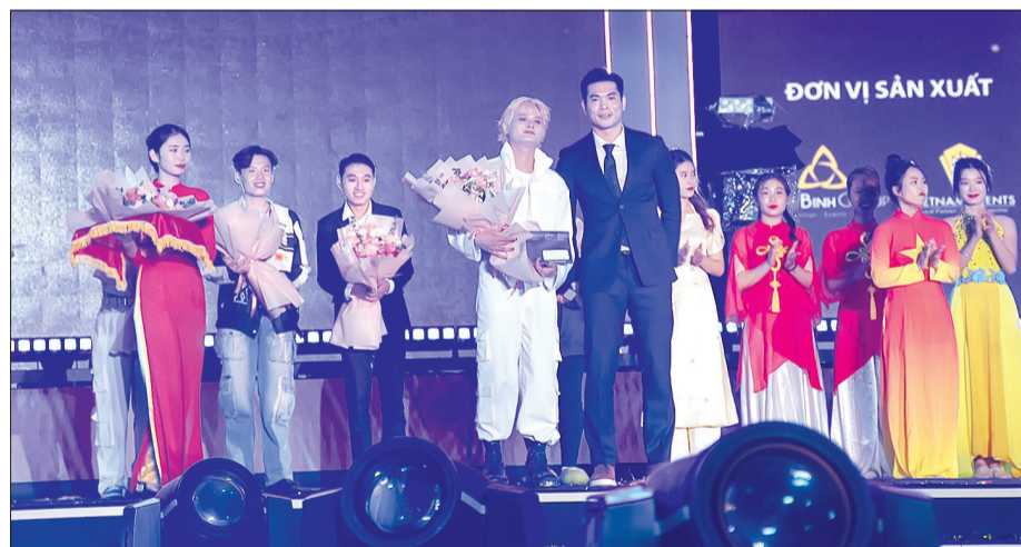
Đại diện Tập đoàn Zenith trao giải nhì cho tiết mục tham dự cuộc thi.

Trong không khí hân hoan, vui mừng khi tham dự chương trình giao lưu văn hóa - kết nối doanh nghiệp Việt Nam - Hàn Quốc “Thái Bình Homecoming Day”, cựu Tổng thống Hàn Quốc Lee Myung Bak xúc động khi thấy tỉnh Thái Bình dành nhiều tâm huyết để tổ chức một sự kiện lớn và mang nhiều ý nghĩa. Cựu Tổng thống Hàn Quốc cho rằng Thái Bình đã vươn mình trở thành tỉnh có tốc độ tăng trưởng kinh tế nhanh, đạt được nhiều kết quả đáng tự hào; tin tưởng Thái Bình sẽ sớm vươn lên trở thành một trong những trung tâm kinh tế lớn của Việt Nam trong thời gian tới. Tự hào về mối quan hệ đối tác chiến lược toàn diện giữa Việt Nam - Hàn Quốc và hai nước đạt được những thành quả to lớn trong nhiều lĩnh vực như kinh tế, văn hóa, y tế, giáo dục... và đặc biệt là giao lưu nhân dân, cựu Tổng thống Hàn Quốc Lee Myung Bak khẳng định: Văn hóa là cây cầu nâng cao sự giao tiếp và hiểu biết giữa chúng ta; sự hợp tác giữa các doanh nghiệp chính là động lực thúc đẩy phát triển kinh tế của hai nước. Chúng ta cùng mong muốn tạo ra nhiều cơ hội hơn cho giao lưu và hợp tác, từ đó củng cố mối quan hệ hữu nghị Việt Nam - Hàn Quốc ngày càng tốt đẹp hơn. Hy vọng rằng sự kiện này sẽ là cơ hội tốt để mọi người dân Việt Nam, nhất là người dân Thái Bình có thể trải nghiệm các hoạt động văn hóa, nghệ thuật và ẩm thực, xích lại gần hơn với người dân và đất nước