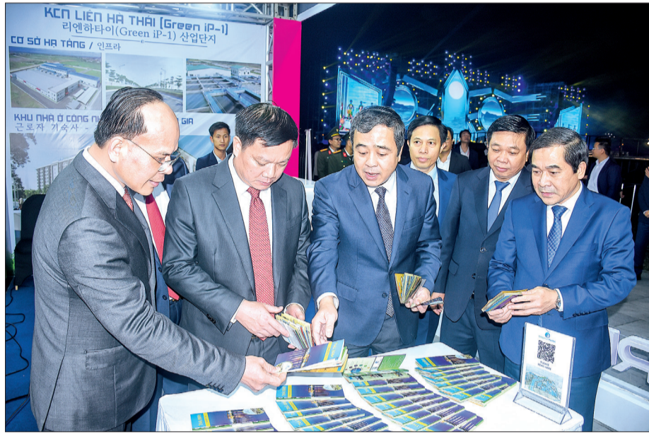
Các đồng chí lãnh đạo tỉnh tham quan gian hàng của Công ty Cổ phần Green i-Park.