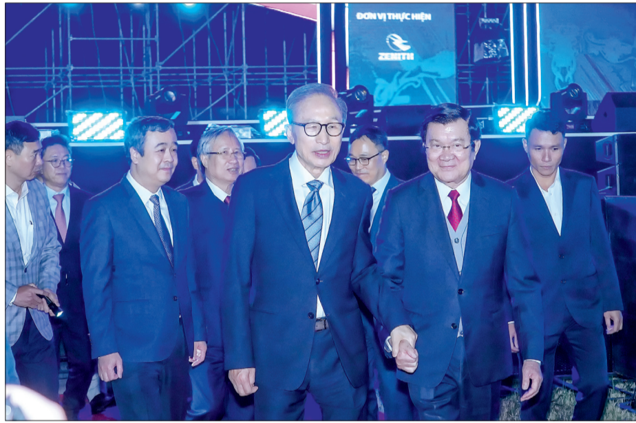
Cựu Tổng thống Hàn Quốc Lee Myung Bak và đồng chí Trương Tấn Sang, nguyên Ủy viên Bộ Chính trị, nguyên Chủ tịch nước cùng các đồng chí lãnh đạo tại chương trình.