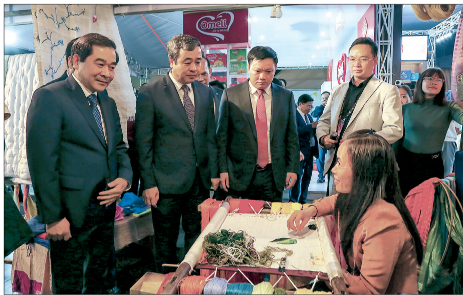
Các đồng chí lãnh đạo tỉnh tham quan gian hàng giới thiệu sản phẩm tại hội chợ.