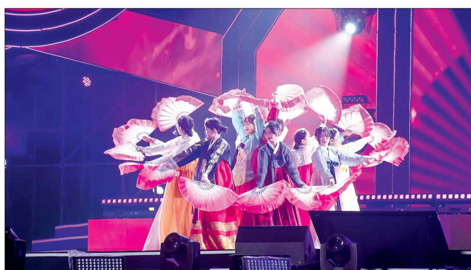
Tiết mục tham dự cuộc thi.

Hàn Quốc. Cựu Tổng thống Hàn Quốc chúc chương trình “Thái Bình Homecoming Day” và hội chợ nông nghiệp quốc tế đồng bằng Bắc Bộ 2023 tại Thái Bình thành công tốt đẹp. Tại buổi lễ, các đại biểu chính khách của Hàn Quốc, các đồng chí nguyên lãnh đạo Đảng, Nhà nước và lãnh đạo tỉnh Thái Bình đã cùng nhau nhấn nút chính thức khai mạc chương trình giao lưu văn hóa - kết nối doanh nghiệp Việt Nam - Hàn Quốc và hội chợ nông nghiệp quốc tế đồng bằng Bắc Bộ 2023; cùng đi thăm gian hàng của các doanh nghiệp trong và ngoài nước trưng bày, triển lãm tại hội chợ. Tối ngày 1/12, ngay sau lễ khai mạc chương trình giao lưu văn hóa - kết nối doanh nghiệp Việt Nam - Hàn Quốc “Thái Bình Homecoming Day”, hội chợ nông nghiệp quốc tế đồng bằng Bắc Bộ năm 2023, tại Quảng trường Thái Bình đã diễn ra cuộc thi giao lưu văn hóa nghệ thuật giữa sinh viên Việt Nam và sinh viên Hàn Quốc với chủ đề: Sắc màu văn hóa Việt - Hàn. Tham gia cuộc thi, sinh viên hai nước Việt Nam, Hàn Quốc đến từ các trường: Đại học Ngoại ngữ, Đại học Quốc gia Hà Nội, Đại học Kinh tế quốc dân, Đại học Kinh tế - Tài chính Thành phố Hồ Chí Minh, Đại học Phenikaa, Đại học Thái Bình, Cao đẳng Văn hóa Nghệ thuật Thái Bình, Cao đẳng Y tế Thái Bình, Cao đẳng Sư phạm Thái Bình đã biểu diễn 14