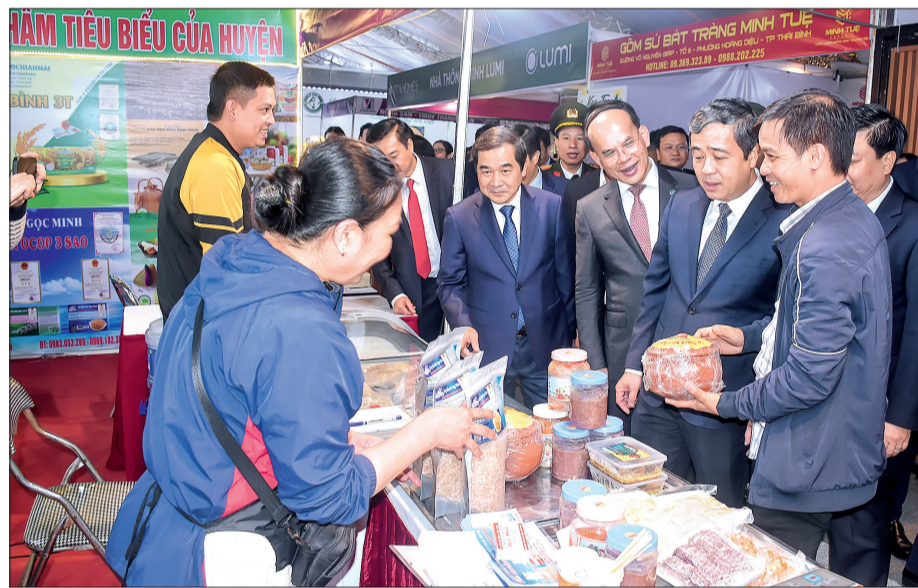
Các đồng chí lãnh đạo tỉnh tham quan gian hàng giới thiệu sản phẩm tại hội chợ.