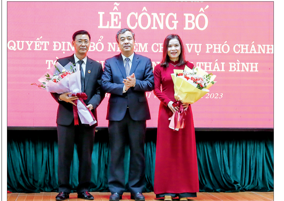
Đồng chí Ngô Đông Hải, Ủy viên Ban Chấp hành Trung ương Đảng, Bí thư Tỉnh ủy chúc mừng các tân Phó Chánh án Tòa án nhân dân tỉnh.