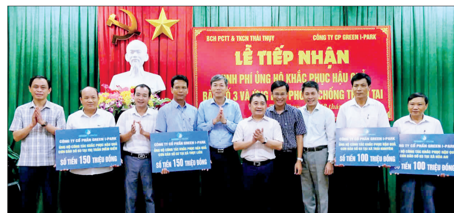
Công ty Cổ phần Green i-Park ủng hộ 1 tỷ đồng cho các địa phương huyện Thái Thụy khắc phục hậu quả sau bão số 3 và ứng phó phòng, chống thiên tai.