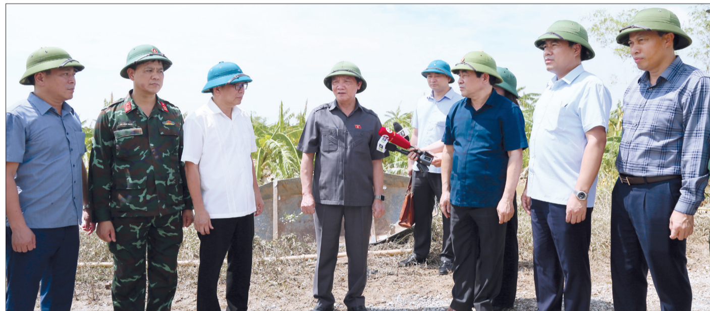
Đồng chí Nguyễn Khắc Định, Ủy viên Ban Chấp hành Trung ương Đảng, Phó Chủ tịch Quốc hội cùng các đồng chí lãnh đạo tỉnh kiểm tra, chỉ đạo công tác khắc phục hậu quả mưa, lũ tại xã Hồng An (Hưng Hà).

ĐỒNG CHÍ NGUYỄN KHẮC ĐỊNH, ỦY VIÊN BAN CHẤP HÀNH TRUNG ƯƠNG ĐẢNG, PHÓ CHỦ TỊCH QUỐC HỘI KIỂM TRA, CHỈ ĐẠO CÔNG TÁC KHẮC PHỤC HẬU QUẢ THIÊN TAI, THĂM, TẶNG QUÀ NGƯỜI DÂN BỊ THIẾT HẠI DO MƯA, LŨ TẠI THÁI BÌNH (Xem tin trang 2)