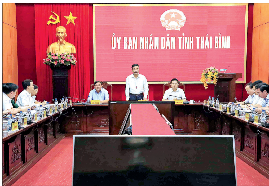
Đồng chí Đặng Trọng Thăng, Phó Bí thư Tỉnh ủy, Chủ tịch UBND tỉnh phát biểu tại cuộc họp.