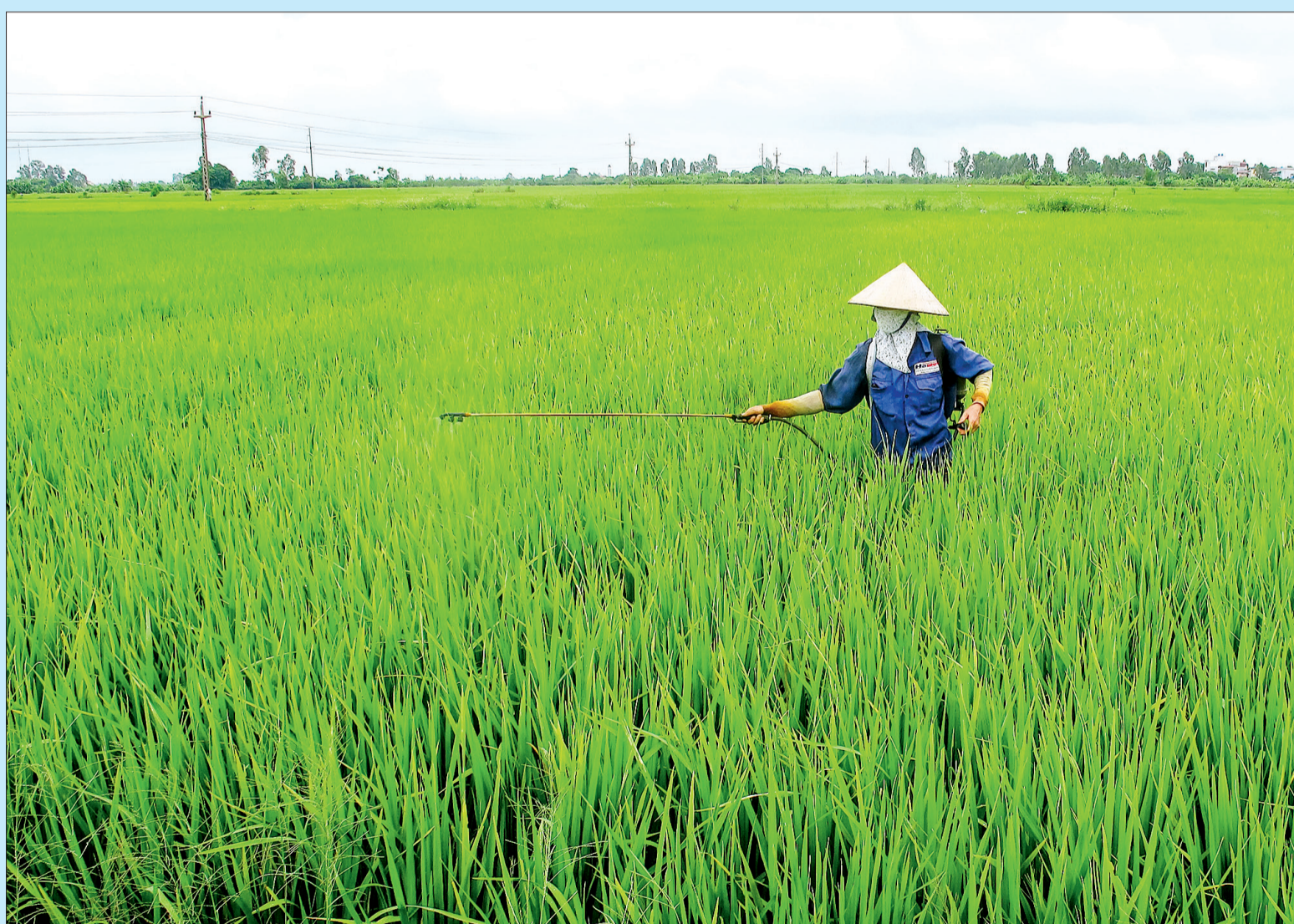
Nông dân huyện Đông Hưng phun thuốc phòng, trừ sâu bệnh bảo vệ lúa xuân.