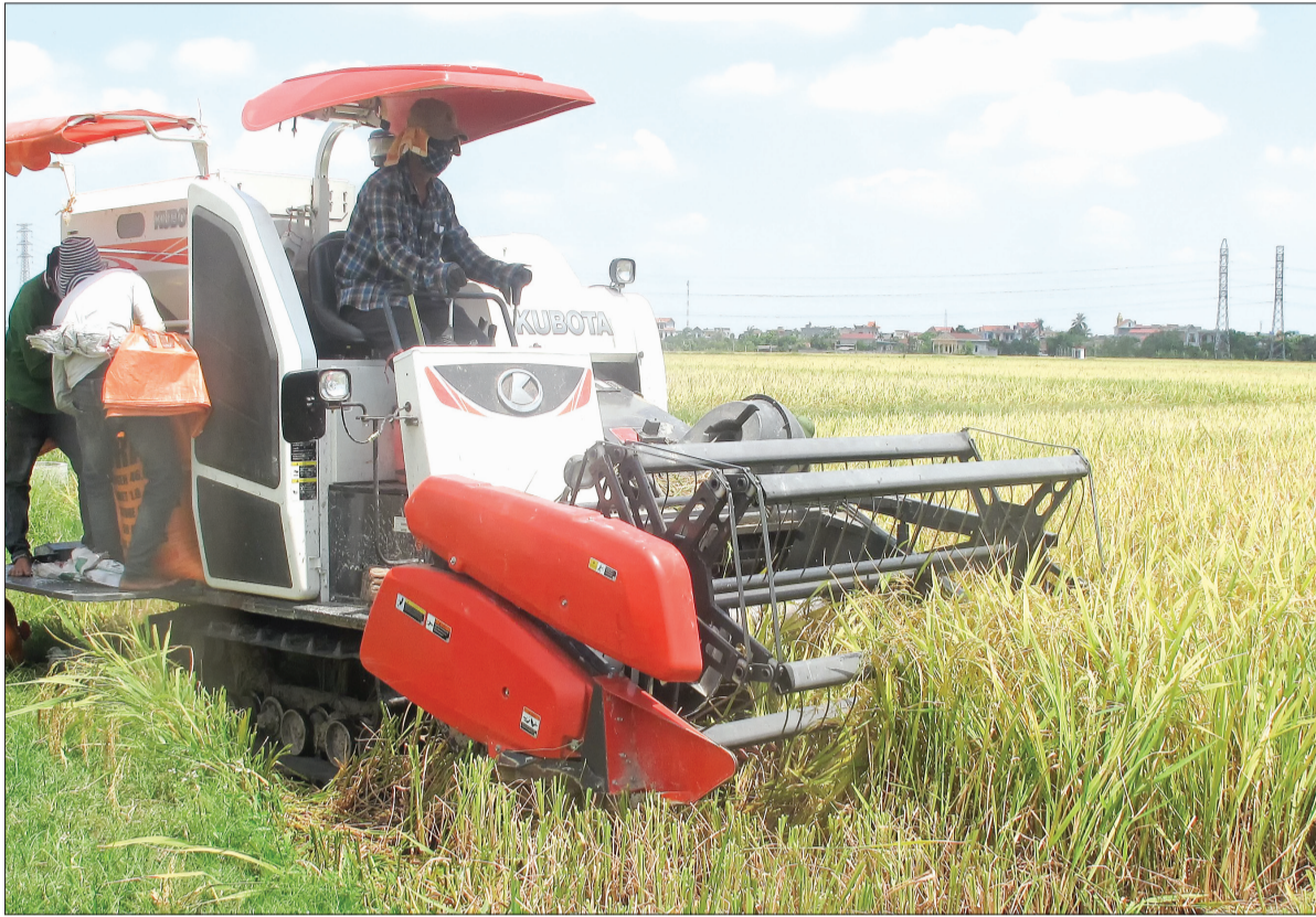
Thu hoạch lúa xuân ở xã Đông Hợp (Đông Hưng).

20.941 tỷ đồng tổng sản phẩm trên địa bàn (GRDP) 6 tháng đầu năm 2017, tăng 8,57% so với cùng kỳ năm 2016 - kết quả đó khẳng định sự lãnh đạo, chỉ đạo của cấp ủy, chính quyền các cấp trong tỉnh cùng cộng đồng doanh nghiệp và các tầng lớp nhân dân nỗ lực vượt qua khó khăn hoàn thành tốt các mục tiêu đã đề ra.