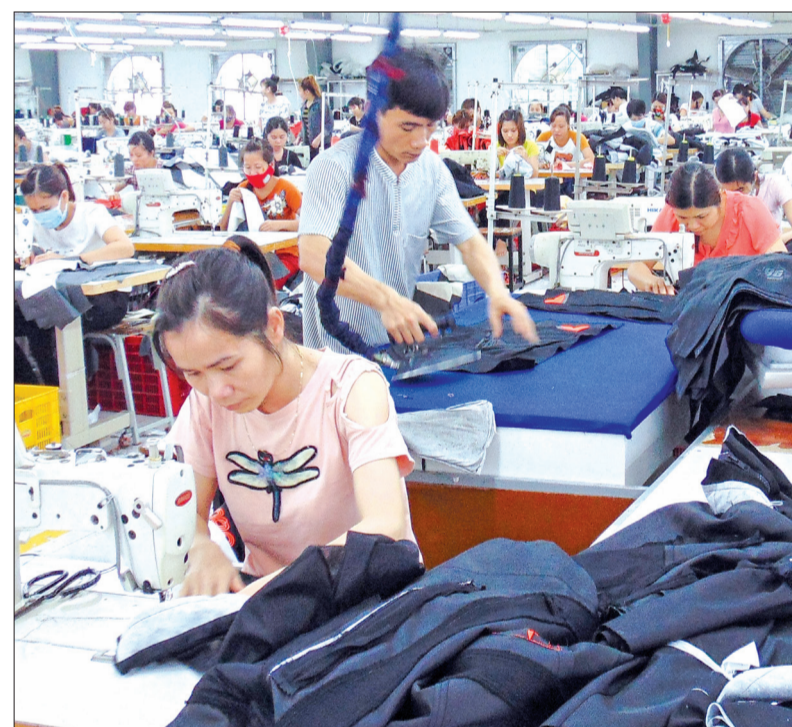
Công ty May Vinap (Thái Thụy) tạo việc làm cho 400 lao động với thu nhập bình quân từ 3,7 - 4 triệu đồng/người/tháng.

năm 2016, một số khoản thu nội địa tăng cao so với cùng kỳ như: thuế phi nông nghiệp tăng 16%, thuế thu nhập cá nhân đạt 19 triệu chỉ, trong đó 186 xã và 1 huyện được công nhận đạt chuẩn quốc gia về nông thôn mới. Đạt được kết quả đó là do ngay từ đầu năm tỉnh đã quan tâm chỉ đạo quyết liệt, chú trọng kiểm tra, kiểm soát, rà soát các khoản thu, đồng viên kịp thời