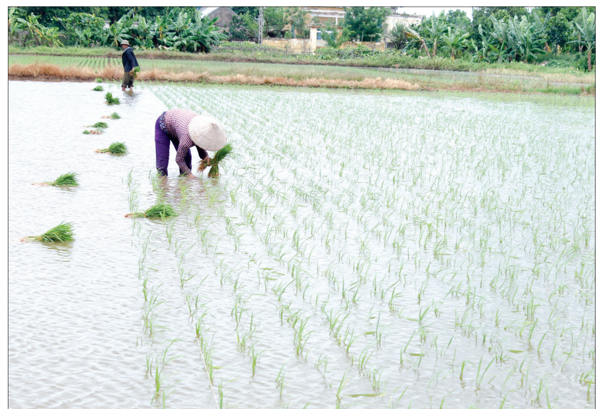
Nông dân xã Vũ Đoài (Vũ Thu) hoàn thành gieo cấy lúa mùa sớm nhất huyện.