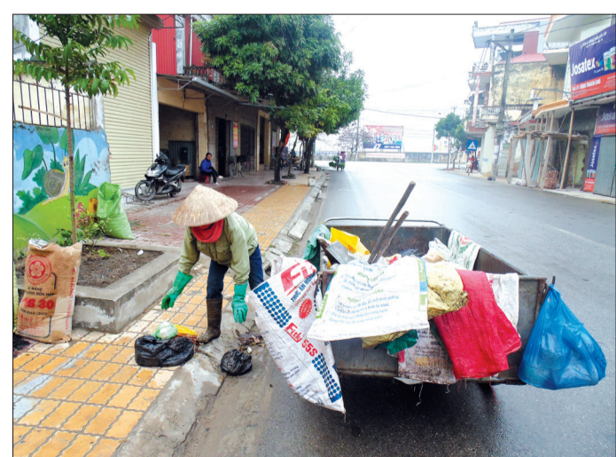
100% xã, thị trấn trên địa bàn tỉnh đã thành lập tổ thu gom rác thải và hoạt động hiệu quả.

chưa kể chi phí đầu tư làm đường ra bãi rác. Hiện hầu hết đường ra các bãi rác vẫn chưa được cứng hóa, chủ yếu là đường đất, gây khó khăn cho việc chuyên chở, nhất là vào mùa mưa. Vì vậy, toàn huyện vẫn còn gần 40 bãi rác tự phát nằm ngay sát đường giao thông. Cùng với đó, tình trạng đổ rác tại địa phận giáp ranh giữa các xã vẫn diễn ra phổ biến, gây khó khăn cho công tác quản lý, kiểm soát, gây ô nhiễm môi trường, bức xúc trong nhân dân. Còn tại xã Trung An (Vũ Thư) dù đã quy hoạch 2 bãi rác tập trung nhưng do không có kinh phí đầu tư xây dựng, toàn xã có 4 thôn thì 2 thôn chưa có tổ thu gom rác thải, chưa có bãi chứa rác. Người dân tại 2 thôn: An Lạc và Bốn Thôn phải tự xử lý rác thải của gia đình. Để “gỡ rối” cho bài toán rác thải sinh hoạt tại khu vực nông thôn, ngày 10/9/2014, HĐND tỉnh