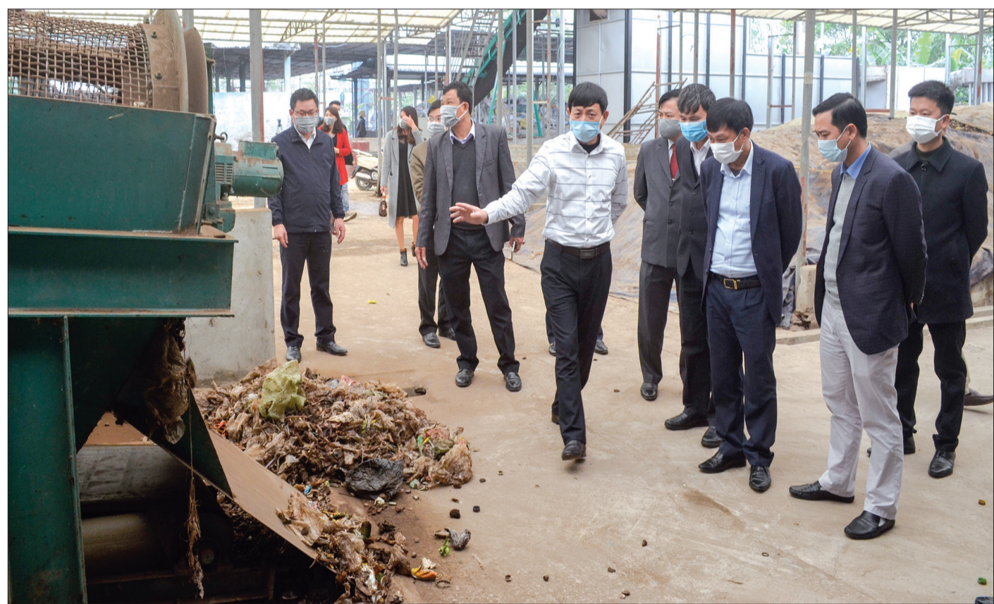
Lãnh đạo Sở Tài nguyên và Môi trường tỉnh Bắc Giang và huyện Lục Ngạn tham quan nhà máy xử lý rác thải Quỳnh Côi (Quỳnh Phụ).

Từ chương trình xây dựng NTM, diện mạo nông thôn Thái Bình ngày càng đổi thay, đời sống người dân được cải thiện. Nhưng bên cạnh đó cũng có nhiều vấn đề phát sinh, nhất là tình trạng ô nhiễm môi trường. Để giải quyết “bài toán” môi trường, ngành Tài chính phối hợp cùng các sở, ngành tham mưu cho tỉnh nhiều cơ chế, chính sách hiệu quả, bảo đảm sự phát triển bền vững.