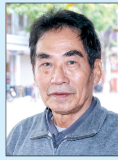
Chiến sĩ Thành cổ Quảng Trị năm 1972 tỉnh Thái Bình nhiệm kỳ 2020 - 2025, trọng tâm là công tác nghĩa tình, gìn giữ, kế thừa và phát huy truyền thống chiến sĩ Thành cổ...