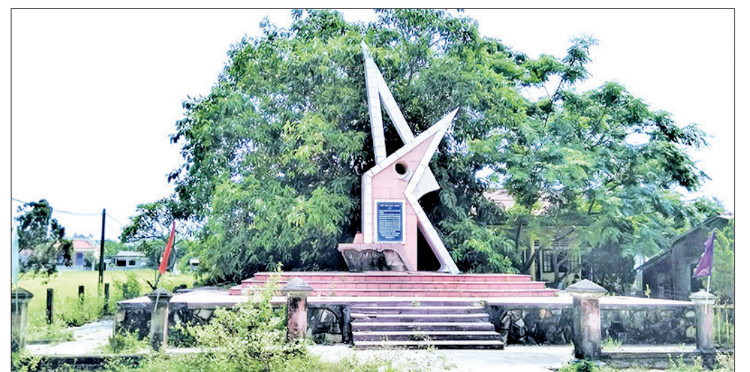
Di tích lịch sử quốc gia chốt thép Long Quang, xã Triệu Trạch, huyện Triệu Phong, tỉnh Quảng Trị.