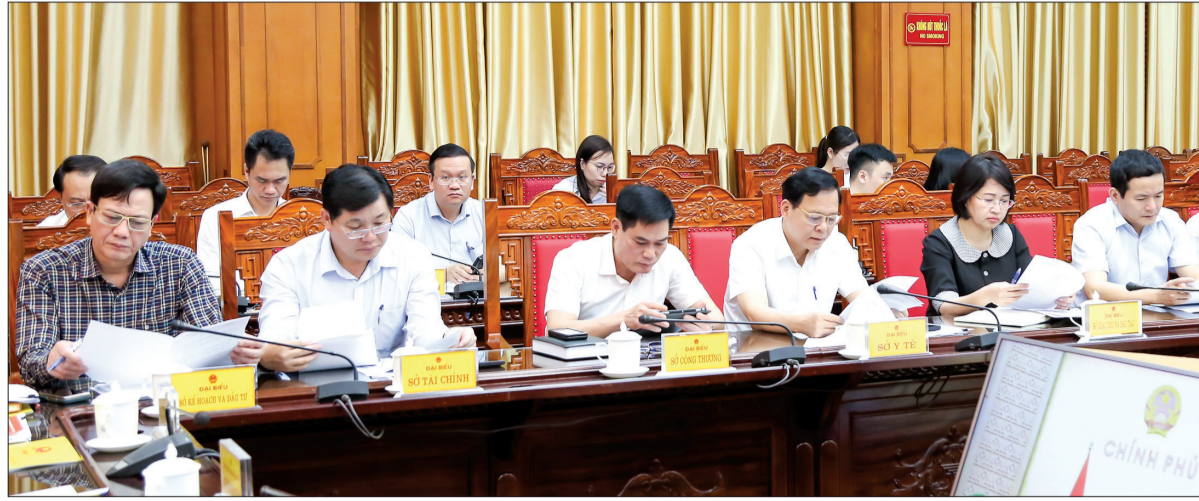
Các đại biểu dự hội nghị tại điểm cầu Thái Bình.

Sáng ngày 3/4, Thủ tướng Phạm Minh Chính chủ trì phiên họp Chính phủ thường kỳ tháng 3/2024 và hội nghị trực tuyến Chính phủ với các địa phương đánh giá tình hình kinh tế - xã hội tháng 3 và quý I/2024, tình hình giải ngân vốn đầu tư công và 3 chương trình mục tiêu quốc gia; tình hình triển khai Nghị quyết số 01/NQ-CP của Chính phủ, công tác chỉ đạo, điều hành của Chính phủ trong tháng 3 và quý I/2024; báo cáo đánh giá bổ sung kết quả thực hiện kế hoạch phát triển kinh tế - xã hội năm 2023 và một số nội dung quan trọng khác.