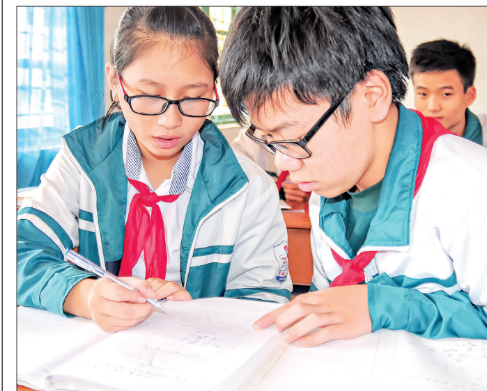
Các thành viên đội tuyển Toán của Trường thảo luận bài.

14/10 luôn dẫn đầu huyện. Năm học 2016 - 2017, Trường có 183 học sinh giỏi cấp huyện, 41 học sinh đạt giải cấp tỉnh, 2 học sinh đoạt giải cấp quốc gia, gần 90% học sinh đạt học lực giỏi.