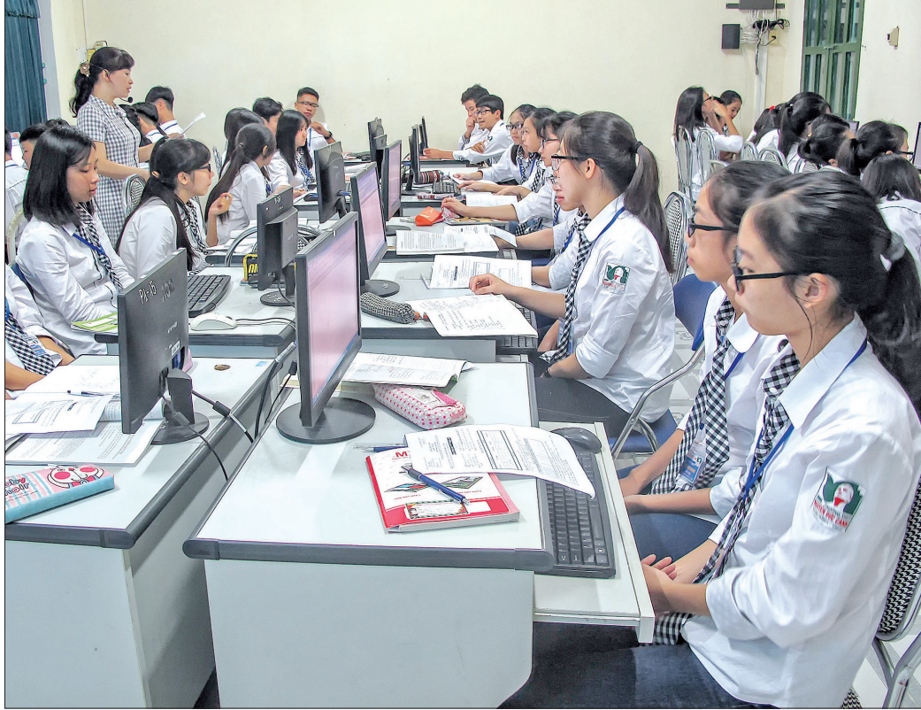
Trường THPT Nguyễn Đức Cảnh kết hợp dạy tin học với định hướng sử dụng thông tin trên internet và mạng xã hội cho học sinh.