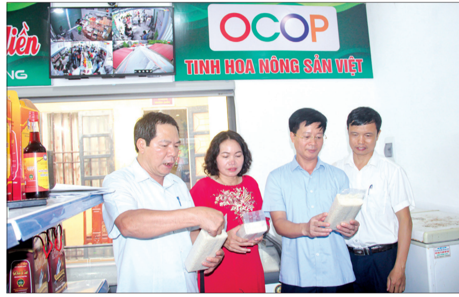
Hợp tác xã Dịch vụ nông nghiệp An Ninh (Quỳnh Phụ) khai trương điểm bán và giới thiệu sản phẩm OCOP.