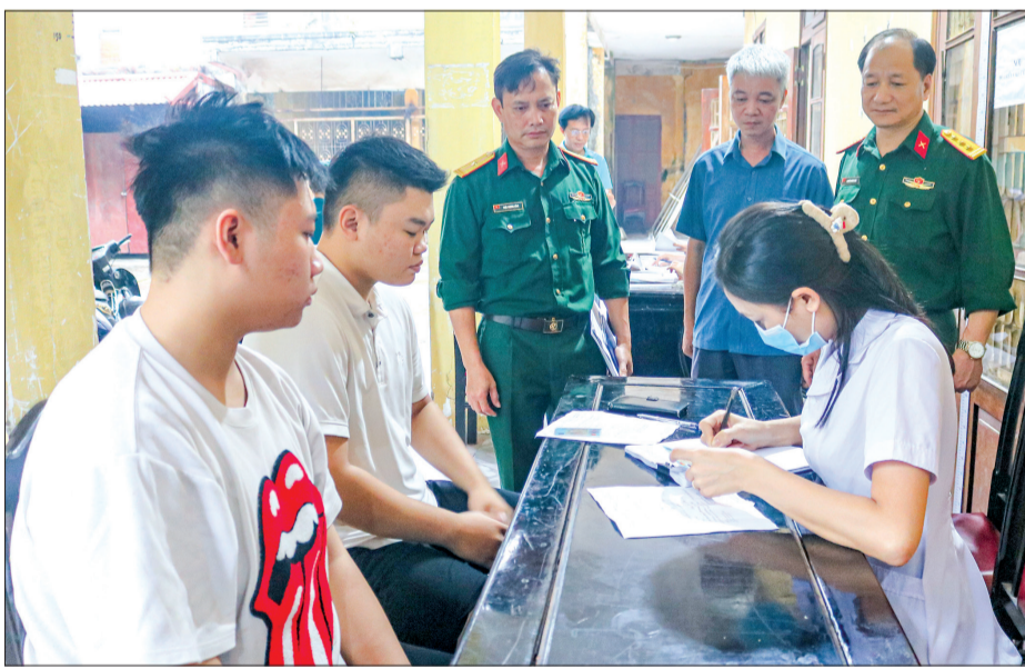
Ban Chỉ huy Quân sự thành phố kiểm tra công tác sơ tuyển nghĩa vụ quân sự tại phường Lê Hồng Phong.