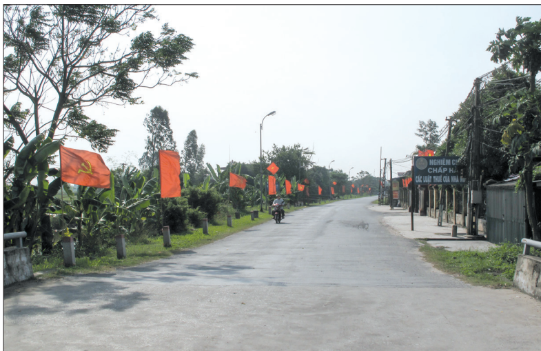
Tận dụng lợi thế có đường chính của huyện chạy qua, nhiều gia đình trong thôn Văn Long phát triển thương mại, dịch vụ cho thu nhập khá.

Thôn Văn Long, xã Vũ Tiến (Vũ Thư) có 380 hộ với 1.500 nhân khẩu, trong đó 45% dân số là đồng bào Công giáo. Trong những năm qua, cán bộ và nhân dân trong thôn luôn đoàn kết, thực hiện tốt các phong trào thi đua yêu nước, các cuộc vận động, 4 năm liền được công nhận là thôn văn hóa tiêu biểu.