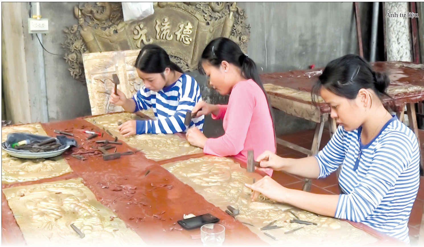
Ảnh tư liệu