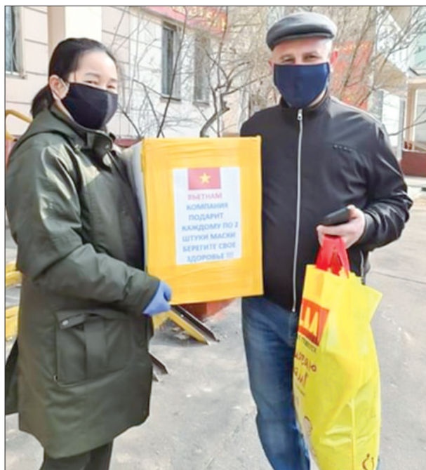
Đại diện Hội đồng hương Thái Bình tại Liên bang Nga trao tặng khẩu trang cho cộng đồng người Nga tại Thủ đô Mát-xcơ-va.

Toàn bộ số khẩu trang vải này do Hội đồng hương Thái Bình tại Liên bang Nga vận động các doanh nghiệp, cơ sở sản xuất hàng may mặc của người Việt Nam tại Thủ đô Mát-xcơ-va tổ chức may và ủng hộ cho Hội. Chất lượng các loại khẩu trang vải bảo đảm và có thể giặt, tái sử dụng 10 lần. Hội đồng hương Thái Bình tại Liên bang Nga thành lập các tổ, huy động hội viên phát miễn phí số khẩu trang trên cho cộng đồng người Việt Nam, công nhân vệ sinh đường phố và bà con người Nga tại 3 quận trung tâm của Thủ đô Mát-xcơ-va.