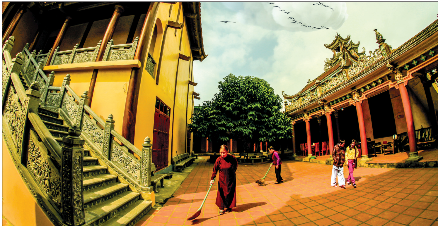
Chùa Ngàn (Viên Quang tự, phường Trần Lâm, thành phố Thái Bình) địa chỉ tàng kinh tạng của các Ấn Hồ tạng (nhà sư Ấn Độ) trong hành trình đến Luy Lâu và truyền giáo ở Việt Nam.