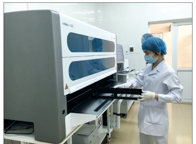
Hệ thống xét nghiệm mẫu bệnh phẩm của người nghi nhiễm Covid-19 tại Trung tâm Kiểm soát bệnh tật tỉnh được vận hành tối đa công suất.

Tổng số mẫu đã xét nghiệm Covid-19 trên địa bàn tỉnh tính đến 17 giờ ngày 11/4 là 2.283 mẫu. Ngoài 884 mẫu xét nghiệm tại Viện Vệ sinh dịch tễ trung ương, Trung tâm Kiểm soát bệnh tật tỉnh đã thực hiện xét nghiệm 1.399 mẫu. Tính riêng từ 17 giờ 15 phút ngày 10/4 đến 17 giờ ngày 11/4, Trung tâm Kiểm soát bệnh tật tỉnh đã thực hiện xét nghiệm 67 mẫu, trong đó 48 mẫu của những người liên quan đến Bệnh viện Bạch Mai và 19 người có triệu chứng của dịch bệnh. 100% mẫu đều cho kết quả âm tính với Covid-19.