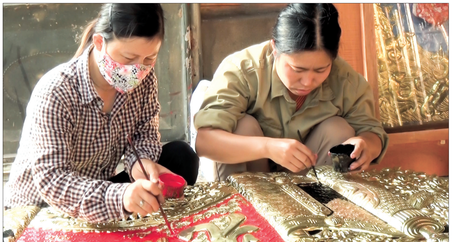
Tay nghề của người thợ chạm bạc Đông Xâm ngày càng tinh xảo.

Nhờ phát triển nghề mà người dân trong làng ngày càng khá giả. Và ấn tượng hơn cả là chưa bao giờ Đông Xâm ngừng tiếng búa, tạo nên nét văn hóa làng nghề đặc sắc nhất trong các làng nghề ở Kiến Xương và tỉnh Thái Bình.