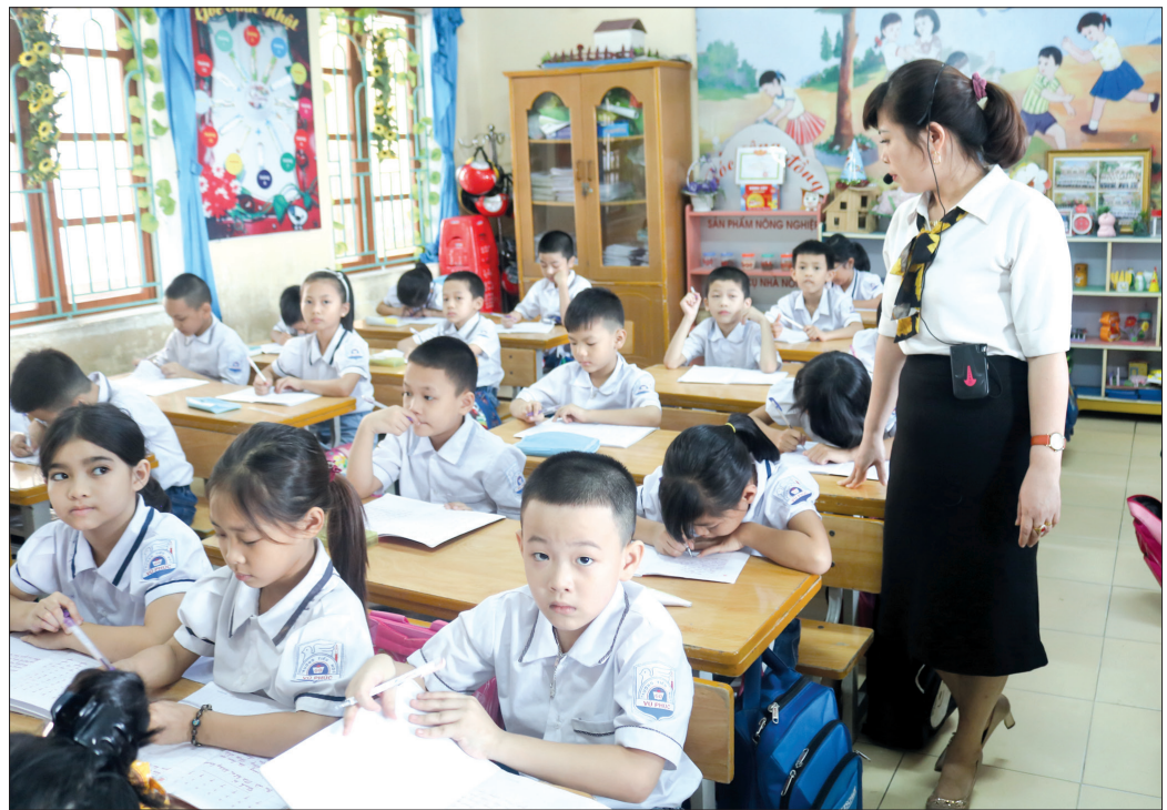
Cô và trò Trường Tiểu học Vũ Phúc (thành phố Thái Bình).

Năm học 2018 - 2019, Thái Bình bắt đầu thực hiện sáp nhập trường học. Đây là cơ sở để tinh giản đầu mối và tinh giản cán bộ, nhân viên. Sau sáp nhập, bộ máy tổ chức tại các cơ sở giáo dục đã bớt công kênh; từng bước khắc phục tình trạng