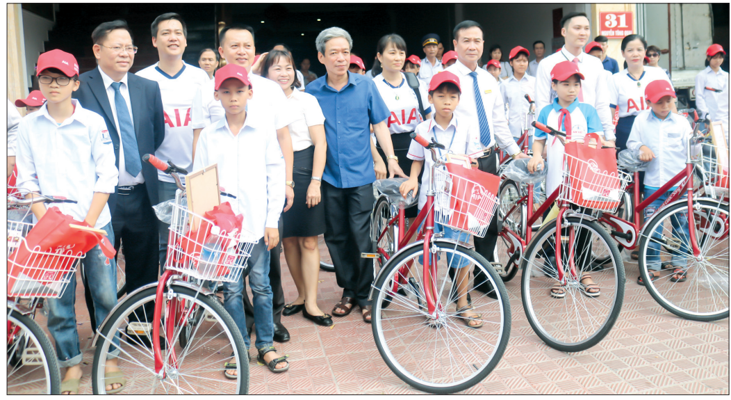
Quý Bảo trợ trẻ em tỉnh phối hợp với Công ty TNHH Bảo hiểm nhân thọ AIA Việt Nam trao tặng xe đạp cho trẻ em có hoàn cảnh khó khăn trên địa bàn tỉnh.

Thời gian qua, các cấp, ngành, địa phương trong tỉnh đã triển khai nhiều giải pháp phòng ngừa, ngăn chặn, xử lý các hành vi xâm hại trẻ em, góp phần xây dựng môi trường sống lành mạnh, an toàn cho trẻ em.