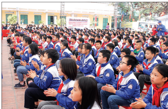
Học sinh Trường Tiểu học Lý Tự Trọng (thành phố Thái Bình) hào hứng theo dõi các hoạt động thực hành tiếng Anh.

Để xây dựng và phát triển môi trường học và sử dụng tiếng Anh trong các trường tiểu học, Bộ Giáo dục và Đào tạo phát động các nhà trường đẩy mạnh giảng dạy tiếng Anh theo chương trình giáo dục phổ thông 2018. Ngoài chương trình dạy học tiếng Anh chính khóa, các trường tích cực liên kết với các trung tâm ngoại ngữ được cấp phép; thường xuyên tổ chức các hoạt động ngoại khóa, tạo môi trường sử dụng tiếng Anh phù hợp với lứa tuổi học sinh tiểu học như: thành lập câu lạc bộ tiếng Anh, tổ chức lễ hội, giao lưu, hội thi bằng tiếng Anh, tổ chức dạy hát, xem video, sách truyện bằng tiếng Anh... Đội ngũ giáo viên tiếng Anh cấp tiểu học chú trọng tự học, nâng cao trình độ chuyên môn, nghiệp vụ giảng dạy tiếng Anh, nhất là kỹ năng phát âm bảo đảm chuẩn quốc tế và thường xuyên giao tiếp với học sinh những câu, từ tiếng Anh đơn giản. Đối với học sinh tiểu học, ngoài nhà