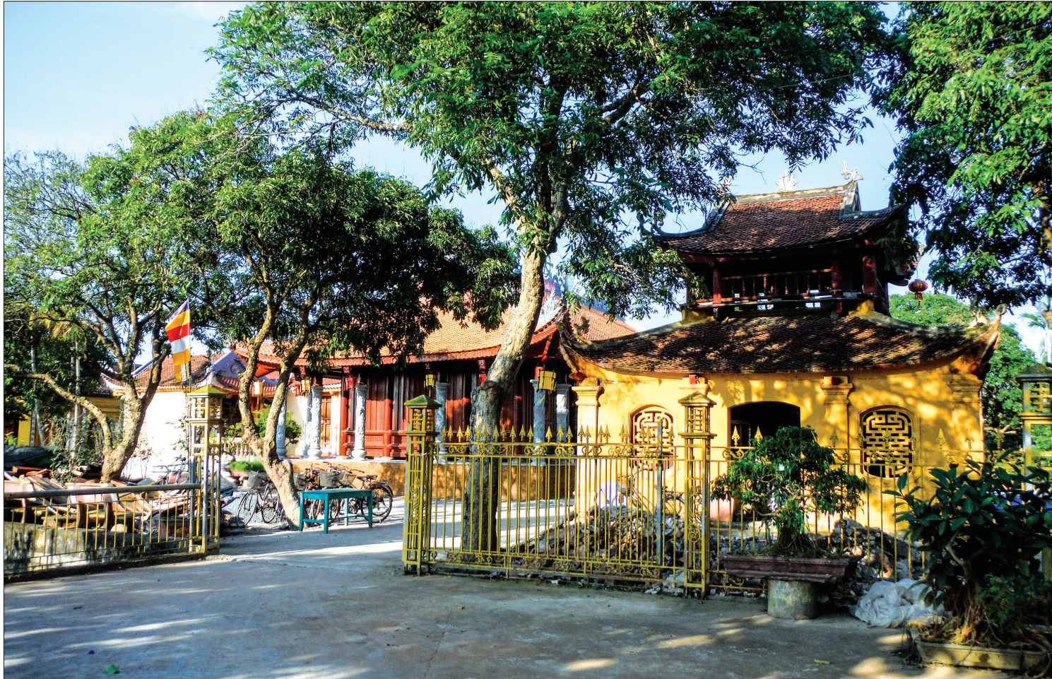
Chùa Bôn, xã Hồng Bạch, huyện Đông Hưng, địa danh cổ thời nhà Trần là căn cứ quân sự được Hưng Đạo Đại vương sử dụng làm bàn đạp tấn công đồn A Lỗ, đánh tan quân Nguyên Mông.

Dưới sự lãnh đạo trực tiếp của các vua Trần, Hưng Đạo vương Trần Quốc Tuấn và Bộ Thống soái Đại Việt, cuộc kháng chiến chống quân Nguyên Mông lần thứ 3 (1288) của quân và dân nhà Trần giành thắng lợi vang dội, đập tan mưu đồ xâm lược Đại Việt của phương Bắc. Chiến thắng oanh liệt là kết quả của tập yếu, trong đó có sự vận dụng linh hoạt, sáng tạo kế sách “lấy gần chờ xa, lấy khỏe chờ mệt, lấy no chờ đói” của quân đội nhà Trần thế kỷ XIII.