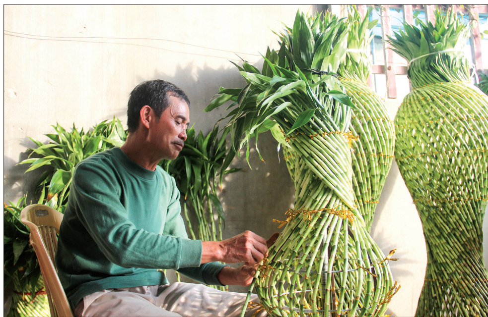
Thành viên HTX DVNN xã Minh Tân (Đông Hưng) tạo dáng cho cây phát lộc phục vụ thị trường tết.

Theo thống kê của Sở Nông nghiệp và Phát triển nông thôn, toàn tỉnh hiện có 344 HTX nông nghiệp, trong đó 315 HTX tổ chức lại hoạt động theo Luật Hợp tác xã năm 2012, 29 HTX thành lập mới,