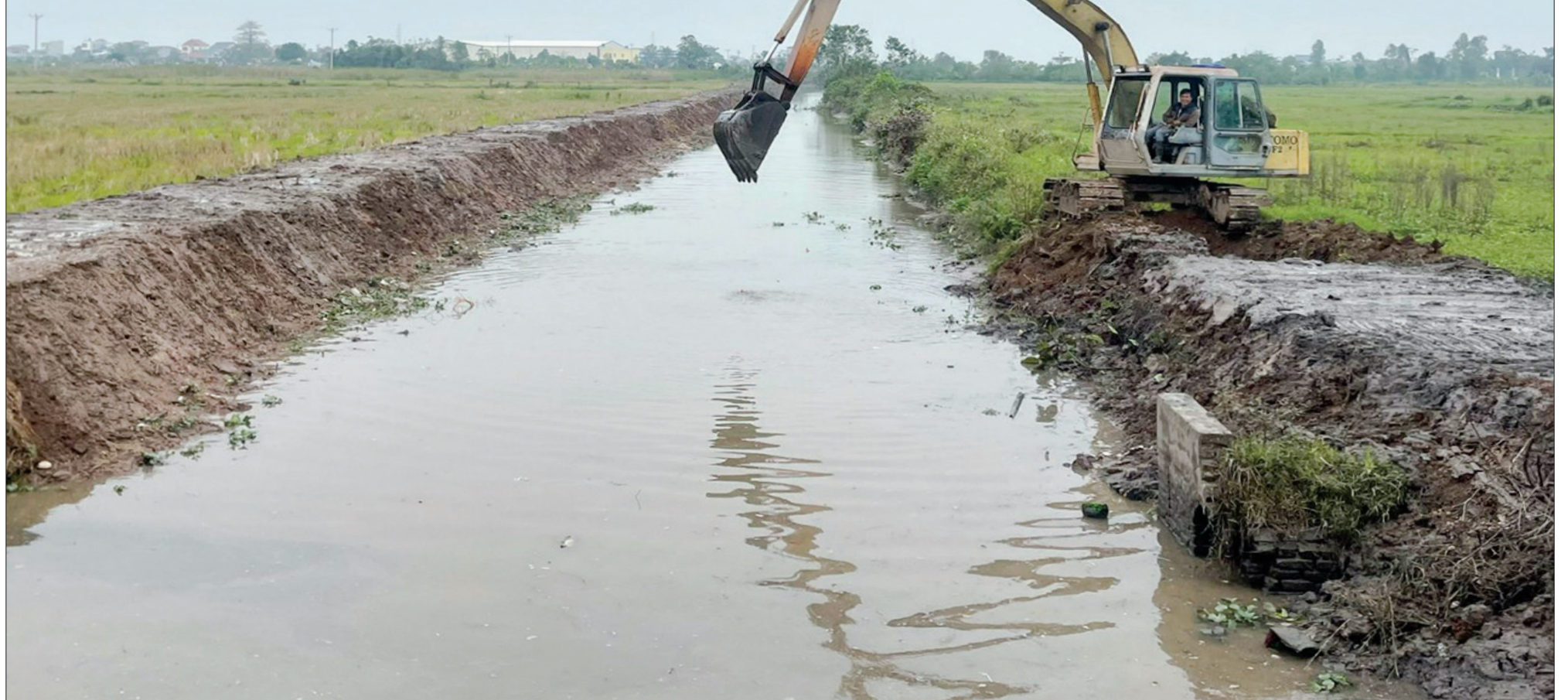
Làm thủy lợi phục vụ sản xuất vụ đông xuân 2022 - 2023 của HTX DVNN xã An Ninh (Quỳnh Phụ).