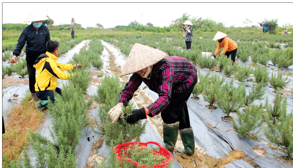
Vùng trồng cây hương thảo chiết xuất tinh dầu của HTX SXKD DVNN Hoàng Minh (xã Quỳnh Hồng, huyện Quỳnh Phụ).

Không chỉ có cách làm sáng tạo, hiệu quả trong hoạt động, sản xuất, HTX đã quy hoạch được vùng tập trung diện tích 15,2ha, áp dụng đồng bộ cơ giới hóa các khâu sản xuất đồng thời bao tiêu đầu ra ổn định, từng bước hướng tới xây dựng thương hiệu gạo của địa phương, thay đổi tư duy sản xuất cũ, manh mún, truyền thống.