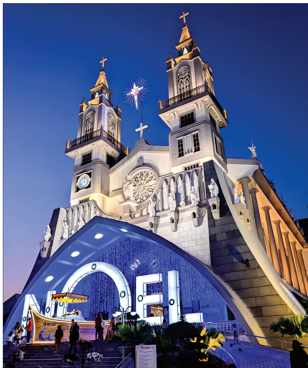
Nhà thờ chính tòa thành phố Thái Bình.

Ngày còn nhỏ, tôi vẫn luôn tin rằng ông già Noel sẽ thực hiện điều ước của những đứa trẻ ngoan ngoãn. Những ngày trước lễ Giáng sinh, tôi và anh trai thường