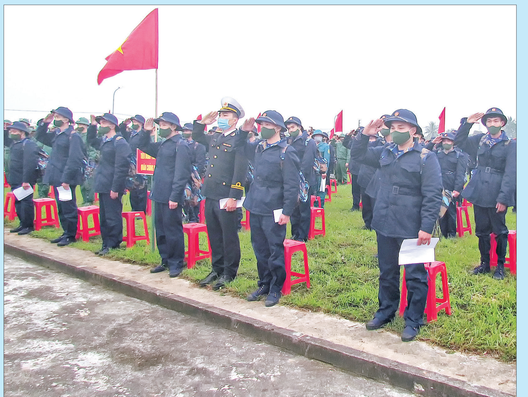
Tân binh huyện Hưng Hà nhập ngũ năm 2021.