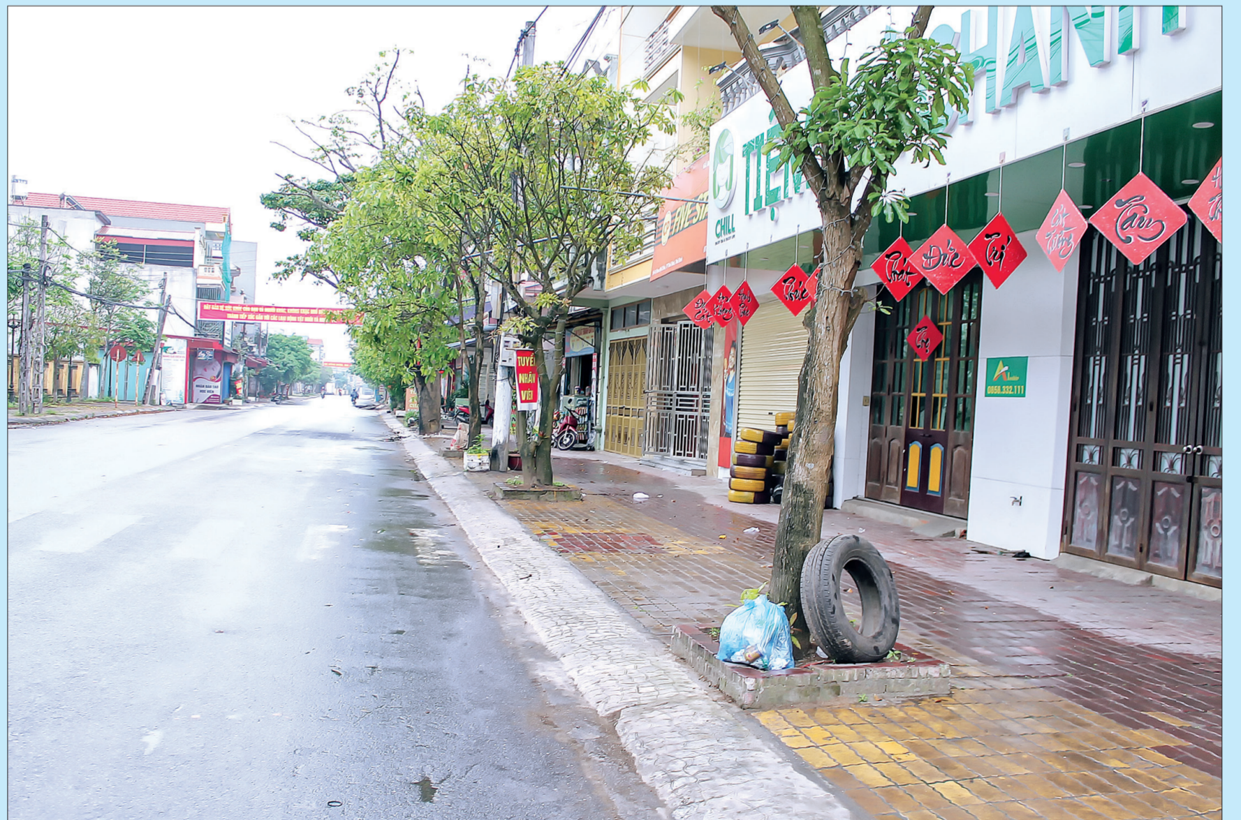
Khu vực trung tâm xã Hòa Bình (Vũ Thư) hầu hết các cơ sở kinh doanh hàng hóa không thiết yếu đã tạm dừng hoạt động.