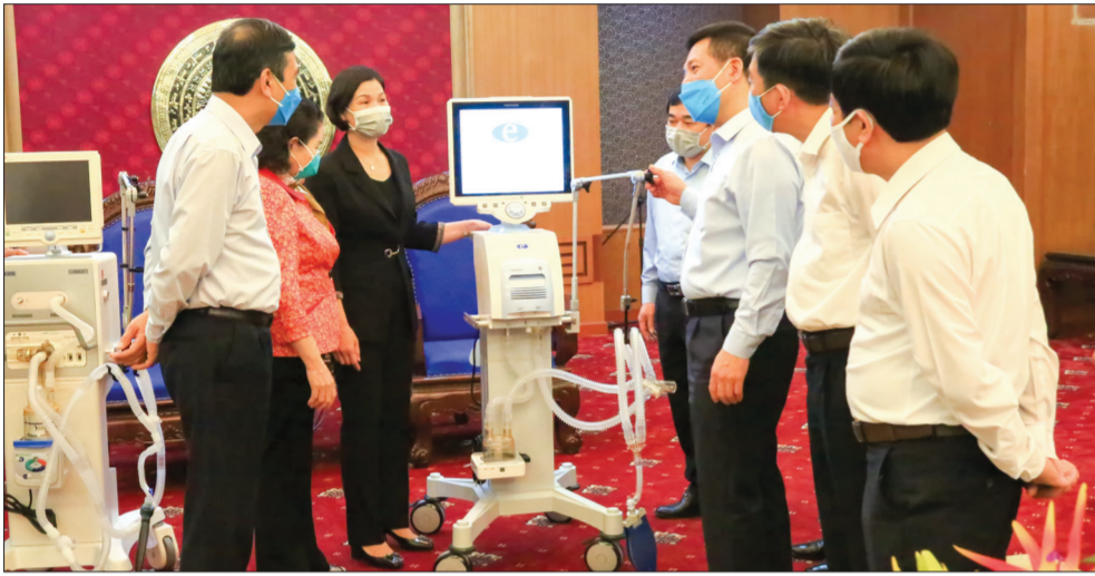
Hai chiếc máy thở sẽ được phân bổ cho Bệnh viện Nhi và Bệnh viện Đa khoa tỉnh phục vụ công tác phòng, chống dịch Covid-19.