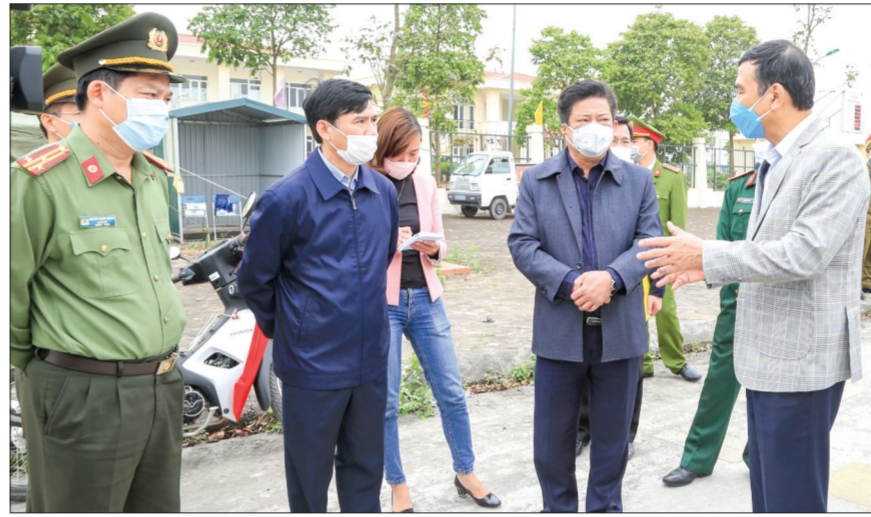
Đồng chí Đặng Trọng Thành, Phó Bí thư Tỉnh ủy, Chủ tịch UBND tỉnh kiểm tra chốt kiểm soát cầu Thái Hà.