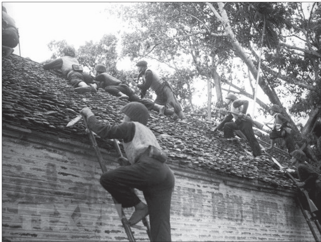
Các chiến sĩ Vệ quốc đoàn chiến đấu kiên cường bảo vệ từng ngôi nhà, tấc đất của Thủ đô.

Trong tình thế hiểm nghèo ấy, Đảng và Chính phủ nước Việt Nam Dân chủ Cộng hòa do Chủ tịch Hồ Chí Minh đứng đầu đã đề ra những quyết sách đúng đắn, sáng tạo: Tổ chức Tổng tuyển cử bầu Quốc hội, Hội đồng nhân dân nhằm củng cố chính quyền cách mạng, xây dựng nền móng cho chế độ mới; phát động phong trào tăng gia sản xuất, xóa bỏ mọi thủ tục vớ vẩn, thực hiện giảm tô, chia lại ruộng công, tịch thu ruộng đất của đế quốc, viết gia chia cho nông dân nghèo; mở lớp bình dân học vụ kêu gọi toàn dân tham gia phong trào xóa nạn mù chữ; xây dựng "Quyết độc lập" và phong trào "Tuần lễ vàng" huy động đóng góp tự nguyện của nhân dân; phát triển lực lượng vũ trang cách mạng theo nguyên tắc toàn diện cả về chính trị và quân sự,