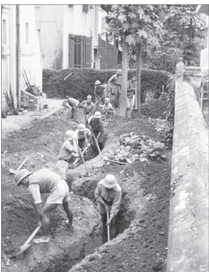
Quân và dân Hà Nội đào giao thông hào ngay trong Bắc Bộ phủ, sẵn sàng chiến đấu chống thực dân Pháp.

Tiếp đó, từ tháng 10/1945 - 1/1946, quân Pháp tiếp tục đánh chiếm nhiều địa bàn quan trọng ở Nam Bộ và Nam Trung Bộ, từng bước thiết lập hệ thống kim kẹp tại cơ sở. Trong bối cảnh đó, để tránh phải đương đầu với nhiều kẻ thù cùng một lúc, Chính phủ Việt Nam Dân chủ Cộng hòa (nhận cung cấp lương thực, nhận tiêu tiền "quan kim", "quốc tệ" đã mất giá...), mặt khác kiên quyết phát động phong trào ủng hộ Nam Bộ kháng chiến, đưa hàng vạn cán bộ, chiến sĩ vào Nam chiến đấu, trực tiếp góp phần làm thất bại âm mưu "đánh nhanh, thắng nhanh" của thực dân Pháp. Do gặp khó khăn ở chiến trường miền Nam, thực dân Pháp không đủ khả năng đánh chiếm ngay miền Bắc, buộc phải đàm phán với Tưởng Giới