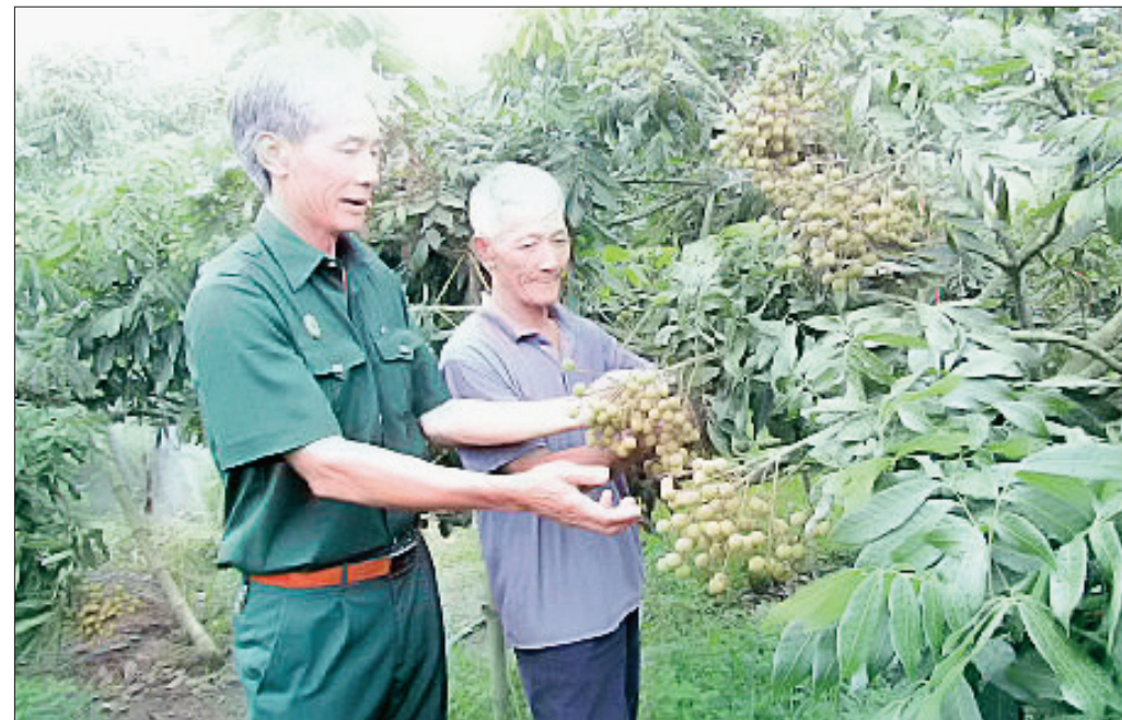
Cựu chiến binh Hưng Hà tham gia phát triển kinh tế.