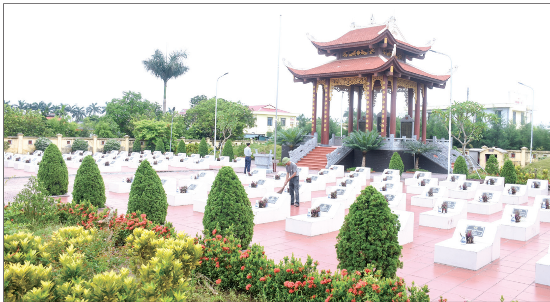
Nghĩa trang liệt sĩ khu vực xã Vũ Lăng (Tiên Hải) khang trang, sạch đẹp.

Hôm nay, toàn Đảng, toàn dân, toàn quân ta kỷ niệm 77 năm ngày Thương binh - Liệt sĩ (27/7/1947 - 27/7/2024), xúc động tưởng nhớ, tri ân những người con anh dũng đã không tiếc tính mạng, máu xương vì nền độc lập, tự do của Tổ quốc, vì cuộc sống hòa bình, hạnh phúc của nhân dân.