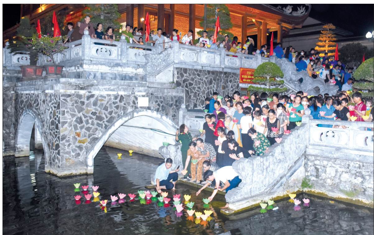
Người dân thả hoa đăng tưởng nhớ các anh hùng liệt sĩ tại Đền thờ Liệt sĩ tỉnh.

Khánh thành năm 2015, Đền thờ Liệt sĩ tỉnh là công trình linh thiêng, trang trọng. Mỗi dịp tháng bảy, nơi đây lại trở thành điểm hẹn của lòng biết ơn, địa chỉ văn hóa tâm linh để mỗi người dân trong và ngoài tỉnh bày tỏ lòng thành kính, biết ơn các anh hùng liệt sĩ. Có lẽ là liệt sĩ, năm nào cũng vậy, vào dịp Tết Nguyên