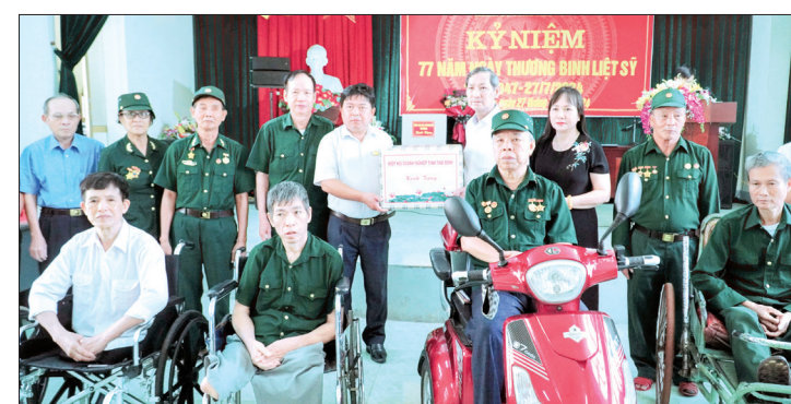
Lãnh đạo Hiệp hội Doanh nghiệp tỉnh và Công ty Cổ phần Quốc tế Bảo Hưng tặng quà các thương bệnh binh tại Trung tâm Nuôi dưỡng và điều dưỡng người có công.

Sáng ngày 26/7, Hiệp hội Doanh nghiệp tỉnh và Công ty Cổ phần Quốc tế Bảo Hưng tổ chức đi thăm, tặng quà các thương binh, bệnh binh nặng tại Trung tâm Nuôi dưỡng và điều dưỡng người có công, cơ sở 2 tại xã Minh Quang (Vũ Thư).