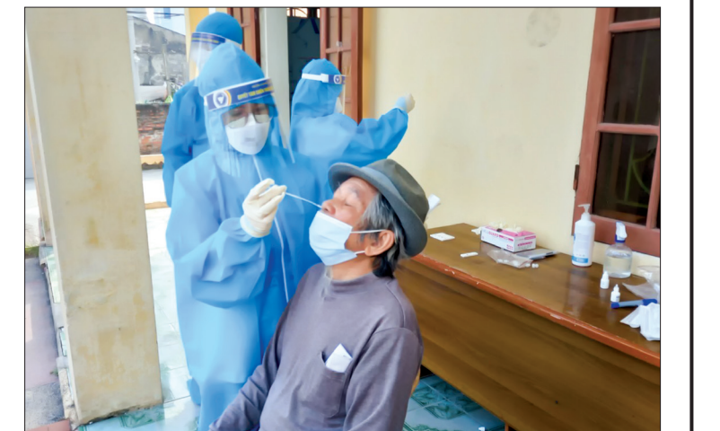
Lấy mẫu xét nghiệm sàng lọc Covid-19 cho người dân thị trấn Vũ Thu (Vũ Thư).

Tính đến 20 giờ ngày 19/11, Thái Bình đã thực hiện tiêm 1.224.150 mũi vắc-xin phòng Covid-19.