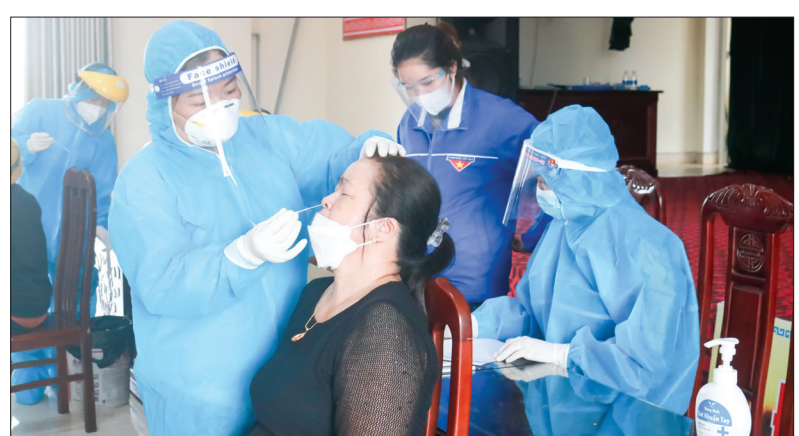
Người dân xã Đông Mỹ (thành phố Thái Bình) được lấy mẫu xét nghiệm sàng lọc Covid-19.

Ngay sau khi nhận được thông tin có 2 công nhân thuê trọ tại địa phương đang làm việc tại Công ty TNHH Gateway Lighting Việt Nam (khu công nghiệp Gia Lễ) có kết quả dương tính với SARS-CoV-2, Ban Chỉ đạo phòng, chống dịch Covid-19 xã Đông Mỹ (thành phố Thái Bình) lập tức triển khai các biện pháp cấp bách phòng, chống dịch với mục tiêu khoanh vùng, dập dịch nhanh, hạn chế lây lan ra diện rộng.