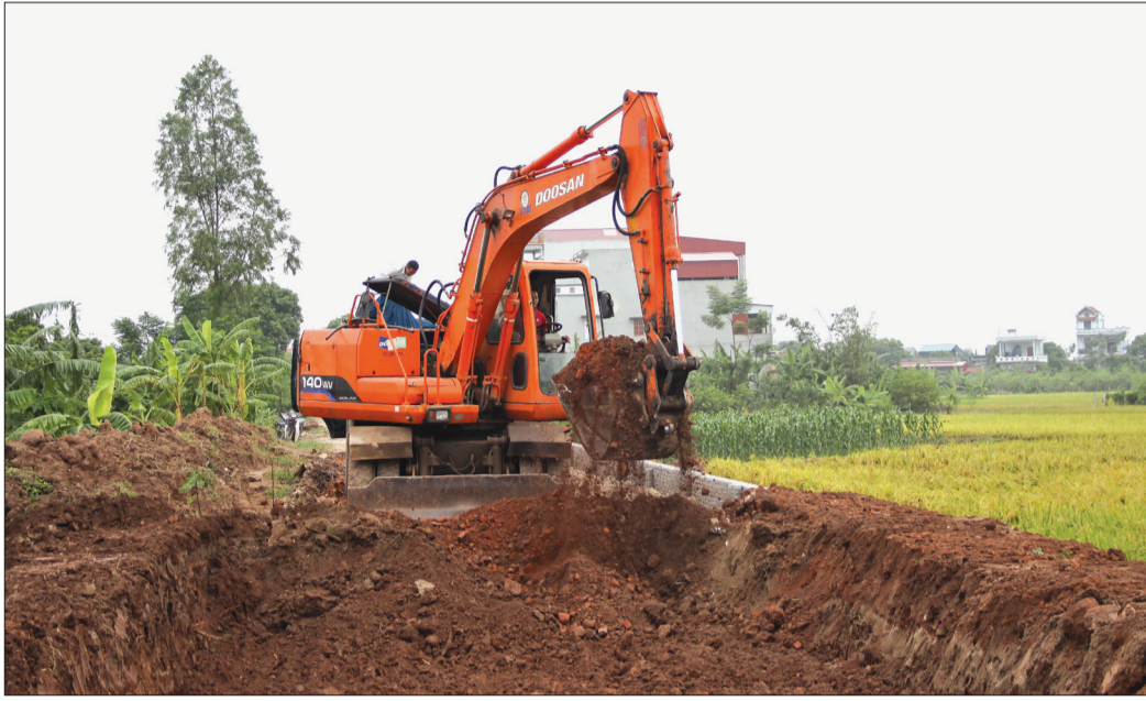
Thi công đường ĐH.64 đoạn qua địa phận xã Thống Nhất (Hưng Hà).

Cùng với các địa phương khác trong tỉnh, thời gian qua, huyện Hưng Hà đã huy động mọi nguồn lực để đầu tư xây dựng, hoàn thiện hệ thống hạ tầng giao thông đường bộ. Đến nay, nhiều công trình đã hoàn thành đạt và vượt kế hoạch để đưa vào sử dụng, đáp ứng