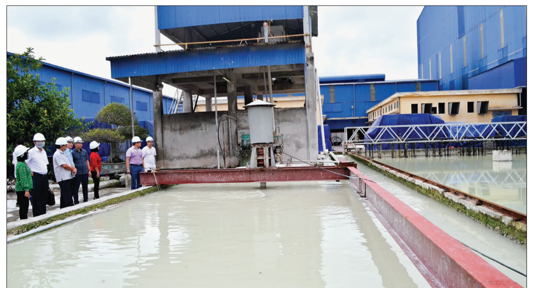
Trạm xử lý nước thải của nhà máy được vận hành tuần hoàn và tái sử dụng.