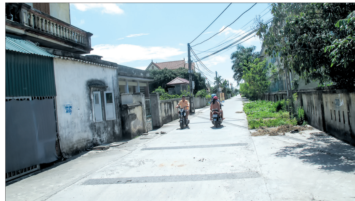
Đường làng, ngõ xóm ở Đồng Cơ luôn sạch đẹp.

biết: Cùng với việc đẩy mạnh công tác tuyên truyền, MTTQ xã còn tích cực tham mưu với cấp ủy và phối hợp chính quyền xã, các tổ chức chính trị, đoàn thể duy trì hiệu quả tổ thu gom rác thải tại 4 thôn với 12 người thường xuyên thu gom rác thải tại các khu dân cư về nơi tập kết xử lý, tổ vận hành xử lý 4 người... Từ năm 2016 xã đã quy hoạch, hoàn thành xây dựng khu xử lý rác thải bằng công nghệ lò đốt kết hợp chôn lấp, với diện tích 3.500m 2 , xây dựng quy chế thu gom và xử lý rác thải, tổ chức thu gom rác thải 4 lần/tháng với mỗi hộ đóng góp 5.000 - 6.000 đồng/tháng để chi trả cho các tổ thu gom rác thải. Hiện nay, việc tập kết và thu gom rác thải đã trở thành nếp nếp trong các khu dân cư góp phần bảo đảm vệ sinh môi trường trên địa bàn xã. Bên cạnh đó, nội dung BVMT cũng được MTTQ xã xây dựng một cách hoàn chỉnh và đưa vào