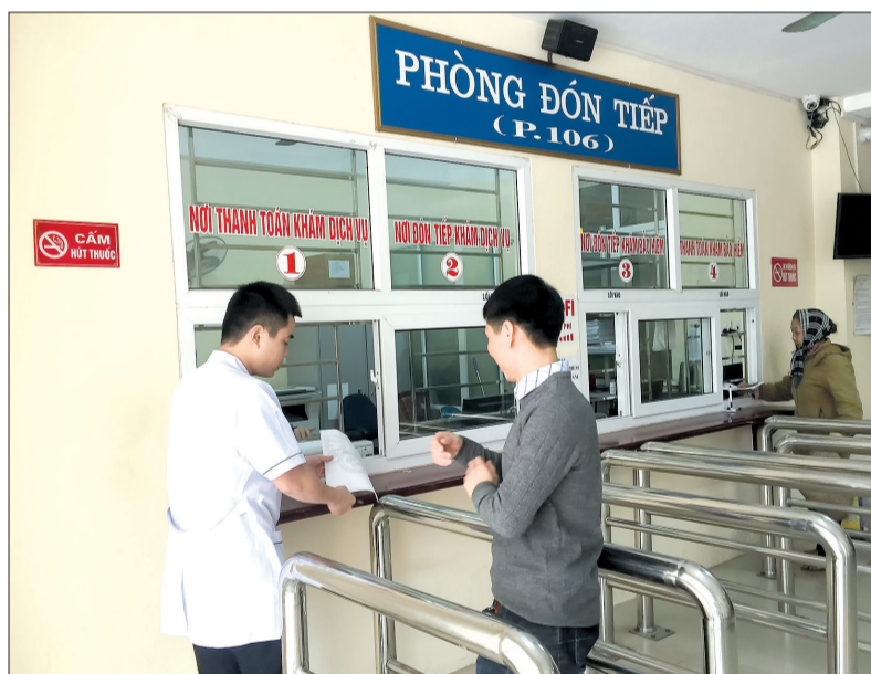
Biển cấm hút thuốc lá được treo ở phòng đón tiếp, nhắc nhở khách hàng không được hút thuốc.