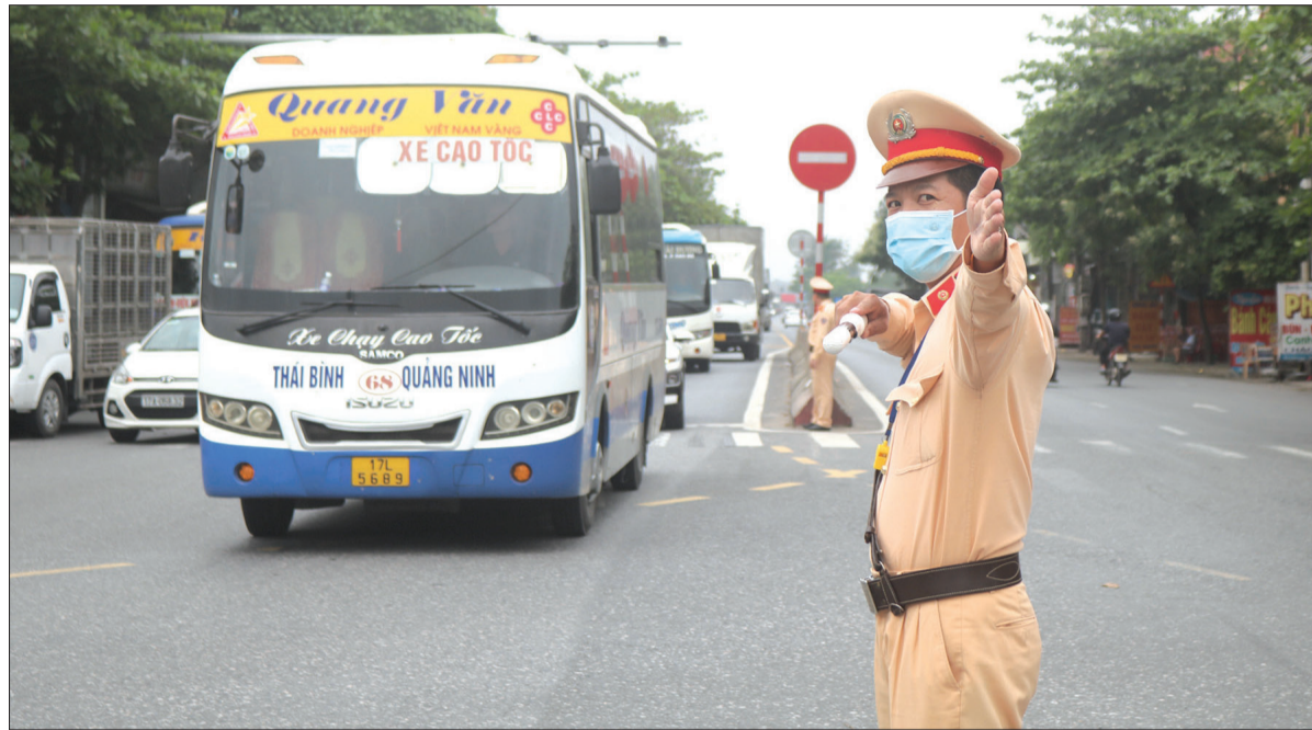
Lực lượng cảnh sát giao thông phân luồng giao thông tại khu vực cửa ngõ ra vào tỉnh.

Diễn ra trong hai ngày 1 - 2/12/2023, chương trình giao lưu văn hóa - kết nối doanh nghiệp Việt Nam - Hàn Quốc "Thái Bình Homecoming Day" là sự kiện quan trọng lần đầu tiên tổ chức tại tỉnh ta. Đến thời điểm này, Công an tỉnh đã triển khai đồng bộ nhiều biện pháp để bảo đảm tuyệt đối an ninh trật tự (ANTT), an toàn