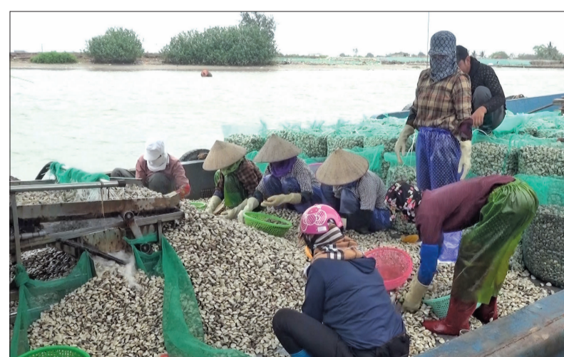
Người dân huyện Tiền Hải thu hoạch ngao.