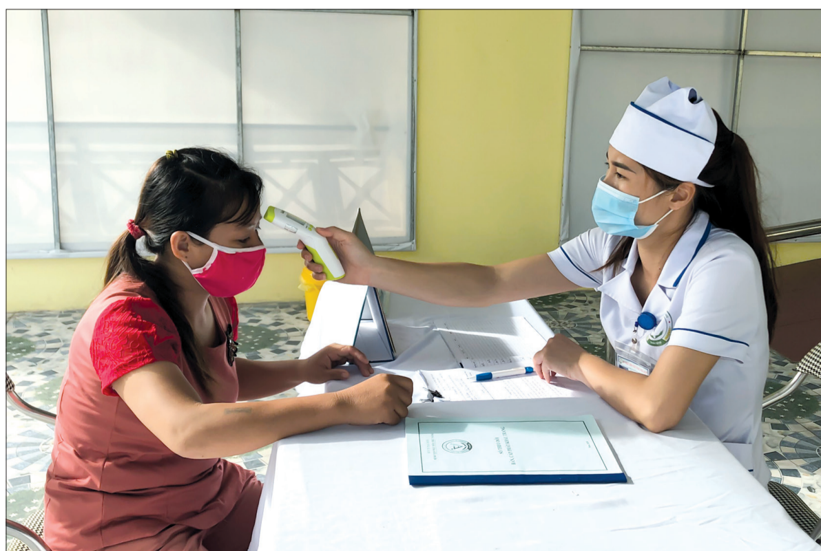
Cán bộ Bệnh viện Phục hồi chức năng tỉnh kiểm tra thân nhiệt người nhà bệnh nhân.