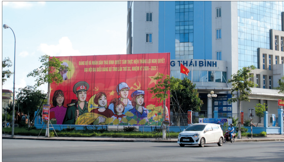
Thành phố Thái Bình tuyên truyền trực quan chào mừng Đại hội.

thống chậu hoa, cây cảnh khu vực Quảng trường Thái Bình, Đền thờ Bác Hồ, Đền thờ Liệt sĩ tỉnh, Quảng trường 14/10, Nhà Văn hóa Lao động tỉnh theo phương án được phê duyệt. Chỉ đạo, đôn đốc các cơ quan, địa phương, đơn vị của thành phố và vận động nhân dân tổng vệ sinh môi trường, treo cờ, băng rôn khẩu hiệu chào mừng Đại hội. Bên cạnh tuyên truyền, cổ động trực quan, công tác thông tin, tuyên truyền trên hệ thống truyền thanh được thành phố chú trọng triển khai thực hiện. Ban Tuyên giáo Thành ủy đã tổ chức hội nghị báo cáo viên quan về Đại hội. Mỗi huyện có từ 3 - 5 pa nô hoặc cụm pa nô, riêng thành phố Thái Bình là 10 pa nô, cụm pa nô; mỗi xã,