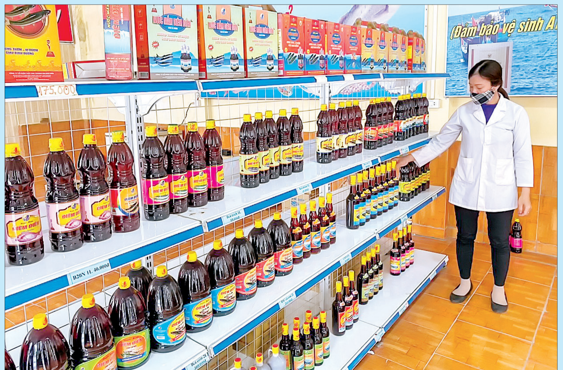
Sản phẩm của Công ty Cổ phần Thương mại thủy sản Diêm Điền đạt tiêu chuẩn OCOP.