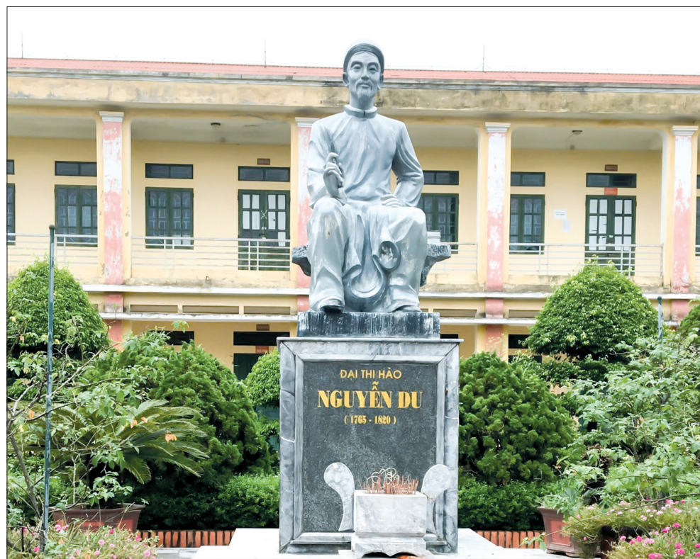
Tượng đại thi hào Nguyễn Du tại Trường THPT Nguyễn Du (Kiến Xương).

Sinh ra trong thời loạn lạc, lớn lên gặp buổi gian nan, đại thi hào Nguyễn Du đã trải qua cuộc đời nhiều thăng trầm trong một giai đoạn lịch sử biến động. Đó là bi kịch của đời ông. Nhưng chính từ bi kịch ấy mà biết bao tác phẩm thơ chữ Hán, thơ chữ Nôm kiệt xuất ra đời, tiêu biểu là “Truyện Kiều”, đã chinh phục người đọc bởi lòng trắc ẩn với những kiếp người bị đẩy đọa cùng chất dân gian bắt nguồn từ chính cuộc sống nông thôn thường nhật. Góp phần hun đúc nên chất hiện thực trong thơ Nguyễn Du có 10 năm ông nương náu, ẩn dật tại vùng quê Thái Bình - khoảng thời gian mà ông gọi là “Thập tải phong trần” (Mười năm gió bụi).