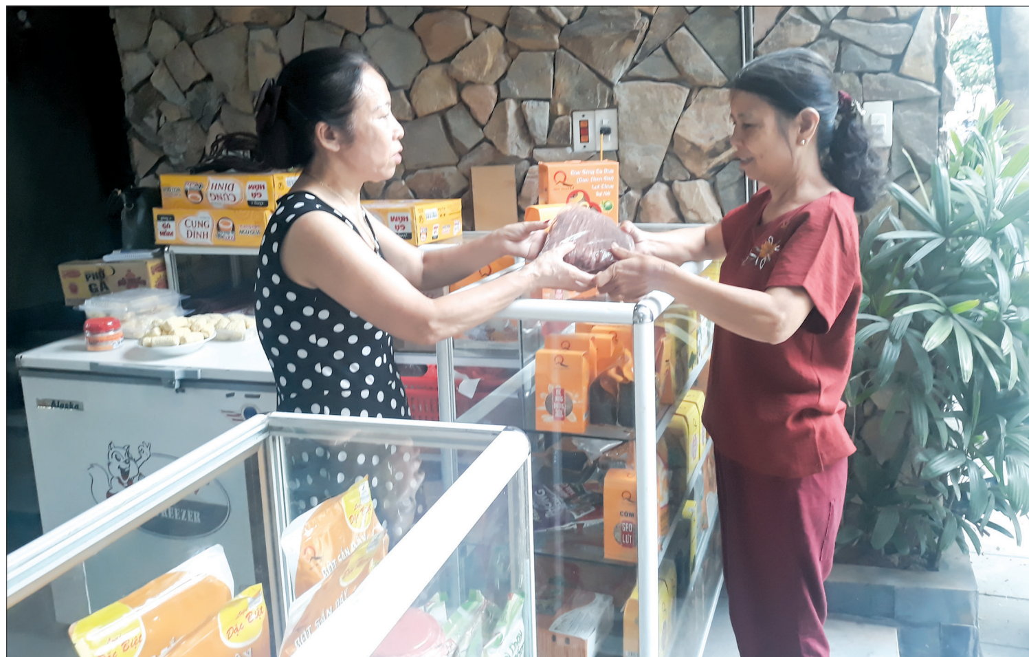
Nhiều cửa hàng bán đồ ăn chay đáp ứng nhu cầu của người tiêu dùng.

Thông thường chỉ sau khi người dân nhập viện với các triệu chứng ngộ độc thực phẩm lúc đó cơ quan quản lý nhà nước mới vào cuộc điều tra, lấy mẫu xét nghiệm, đưa ra cảnh báo. Vụ ngộ độc mới đây nhất do sử dụng sản phẩm pate Minh Chay của Công ty TNHH Hai thành viên Lối sống mới có vi khuẩn Clostridium Botulinum khiến nhiều người phải nhập viện cấp cứu là một ví dụ. Vụ việc xảy ra đã hơn 10 ngày song đến nay vẫn chưa có câu trả lời thỏa đáng của ngành chức năng, còn người tiêu dùng rất hoang mang, lo lắng và cũng cho thấy những “lỗ hổng” trong quản lý thực phẩm chay.