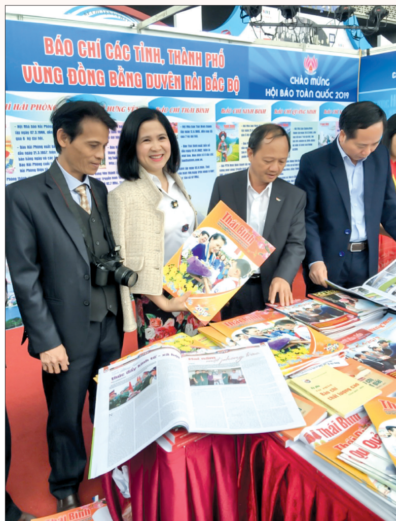
Hội báo toàn quốc năm 2019.

Với những người làm báo, đạo đức nghề nghiệp quan trọng hơn cả, vì nếu không có đạo đức nghề nghiệp thì người làm báo chắc chắn sẽ mang tư tưởng cá nhân của mình mà lấn át những quy chuẩn đạo đức chung của nghề nghiệp đã được quy định. Với một cá nhân phóng viên là vậy nhưng nếu lãnh đạo một cơ quan báo chí mà quên mất đạo đức nghề nghiệp thì sự sa ngã còn ảnh hưởng lớn hơn nhiều. Chúng ta luôn có niềm vui khi thấy các nhà báo luôn tôn trọng đạo đức nghề nghiệp và