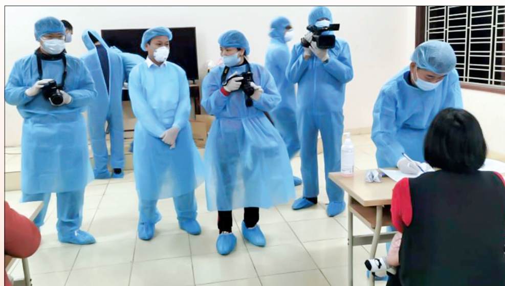
Phóng viên Báo Thái Bình, các cơ quan báo chí trung ương và địa phương tác nghiệp tại khu cách ly tập trung phòng, chống dịch Covid-19 của tỉnh.