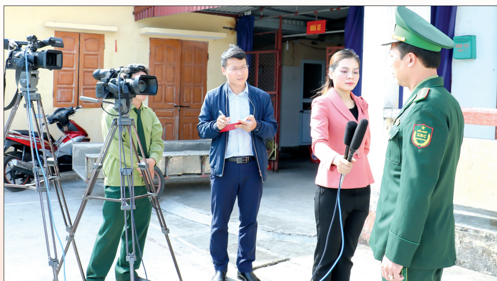
Phóng viên Báo Thái Bình, Đài PTTH Thái Bình tác nghiệp tại cơ sở.

Các phóng viên, hội viên Chi hội Báo Thái Bình luôn được tạo điều kiện tham gia các lớp đào tạo, bồi dưỡng nâng cao trình độ lý luận chính trị và chuyên môn nghiệp vụ. Đặc biệt, mỗi phóng viên, hội viên đều xác định phải tự học, tự rèn, nhất là về bản lĩnh chính trị, tính khách quan. Đến nay, Báo Thái Bình đã xây dựng đội ngũ những người làm báo có bản lĩnh chính trị vững vàng, đạo đức nghề nghiệp trong sáng, trình độ chuyên môn nghiệp vụ cao. Cụ thể: gần 90% cán bộ, phóng viên, hội viên đã có trình độ trung cấp lý luận chính trị, trong đó gần 30% phóng viên, nhà báo có trình độ cao cấp lý luận chính trị; 100% phóng viên, nhà báo có trình độ chuyên môn đại học và trên đại học. Nhiều năm qua, Báo Thái Bình luôn hoàn thành xuất sắc nhiệm vụ chính trị được giao.