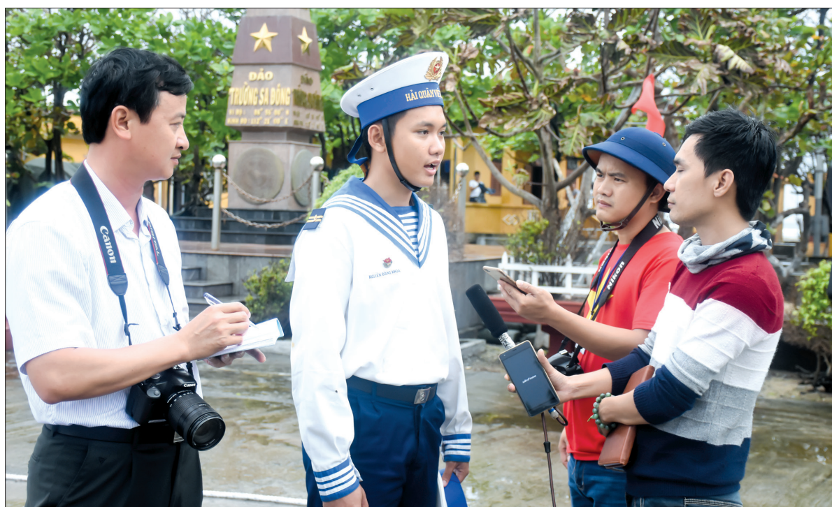
Phóng viên Báo Thái Bình tác nghiệp tại đảo Trường Sa Đông.

Xã hội đang sống ở thời đại công nghiệp 4.0 song ở bất cứ giai đoạn nào của lịch sử và với bất cứ ai để sống và tồn tại được nhất định phải có đạo đức, đạo đức là một phạm trù rất chung và cũng rất riêng. Trong xã hội có đạo đức xã hội và từng ngành nghề để tồn tại và phát triển được thì cũng phải có đạo đức của ngành nghề mình. Trong cuộc sống, mỗi cá nhân cũng phải có đạo đức của riêng mình và đạo đức đó phải được gắn với với truyền thống gia đình, truyền thống quê hương và bên cạnh đó là gắn với đạo đức nghề nghiệp của mỗi con người.