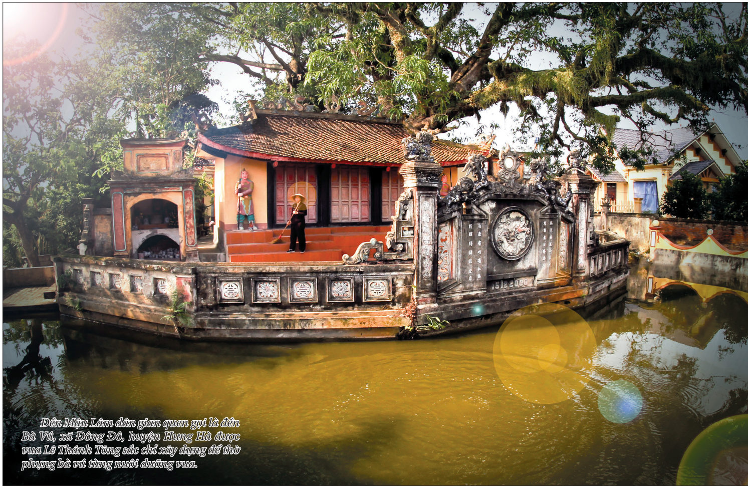
Đền Mậu Lâm dân gian quen gọi là đền Bà Vú, xã Đông Đò, huyện Hưng Hà được vua Lê Thánh Tông sắc chỉ xây dựng để thờ phụng bà vú từng nuôi dưỡng vua.

Tương truyền, khi vua Lê Thánh Tông đánh thắng quân Chiêm Thành trở về, Hoàng thái hậu Ngô Thị Ngọc Dao thân chinh đi đón vua. Trên đường cùng vua Lê Thánh Tông về kinh, Hoàng thái hậu có nhắc tới chuyện khi xưa lánh nạn ở quê ngoại Đò Kỳ và nơi ấy đã sinh ra Hoàng đế. Vua Lê Thánh Tông vô cùng cảm kích đã cho dựng đền thờ ngoại tổ mẫu ở Đò Kỳ (Đông Đò), Đón Ngoại (Chi Lăng, Hưng Hà), Sáo Đền (Song An, Vũ Thư) và đền thờ các bà vú ở làng Đón Ngoại, làng Sâm (Mậu Lâm) vì đã dành cho vua những giọt sữa ân tình và ở Đò Kỳ bây giờ vẫn còn đền thờ Hoàng thái hậu Ngô Thị Ngọc Dao.