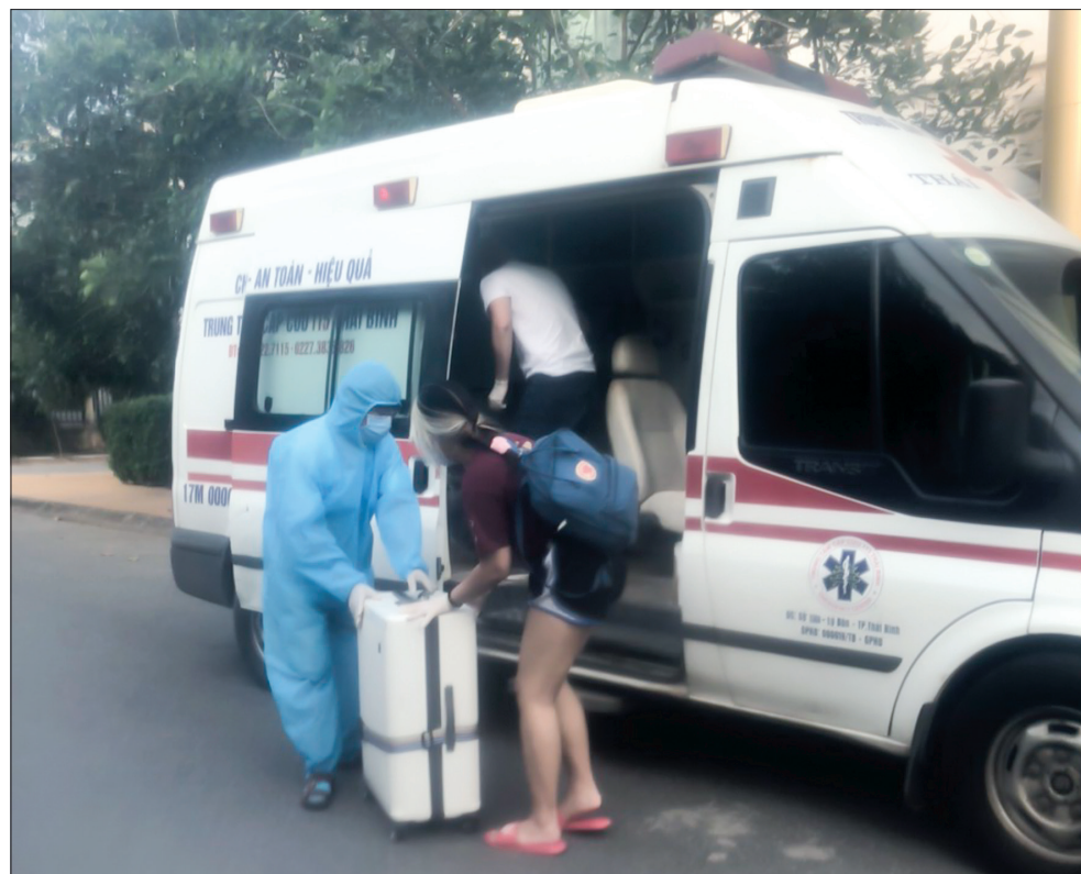
Cán bộ Trung tâm Cấp cứu 115 vận chuyển người từ vùng có dịch về đi cách ly tập trung.

Dịch bệnh chưa kết thúc, cán bộ Trung tâm Cấp cứu 115 tỉnh vẫn đang thực hiện nhiệm vụ kép vừa vận chuyển cấp cứu vừa vận chuyển người nhiễm, nghi nhiễm. Niềm vui với họ là được chở những người đã được điều trị khỏi, những người hết thời gian cách ly trở về nhà và mong muốn lớn nhất của họ là dịch bệnh sớm qua đi.