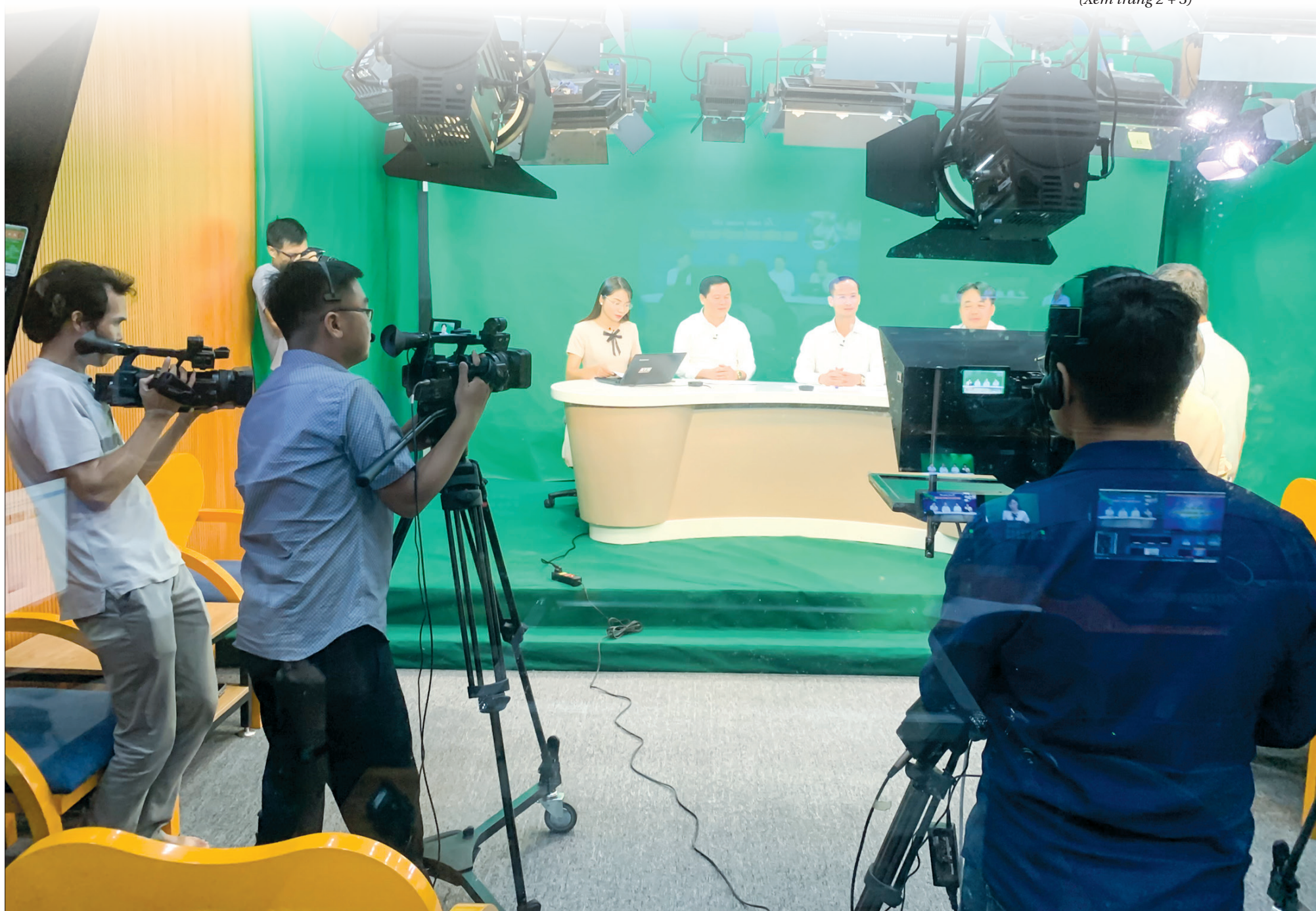
Báo Thái Bình tổ chức chương trình giao lưu trực tuyến "Tu vấn mùa thi - Định hướng nghề nghiệp" năm 2020.