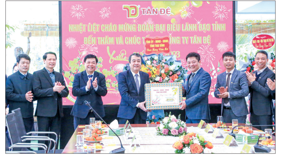
Đồng chí Ngô Đồng Hải, Ủy viên Ban Chấp hành Trung ương Đảng, Bí thư Tỉnh ủy cùng các đồng chí lãnh đạo tỉnh chúc mừng năm mới Công ty Cổ phần Sản xuất hàng thể thao Tân Đệ.