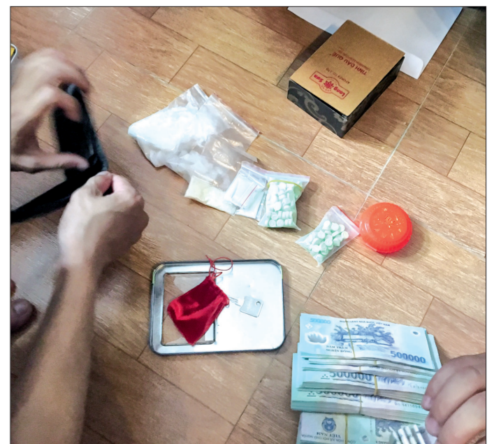
Lực lượng công an phát hiện nhiều loại ma túy tổng hợp.