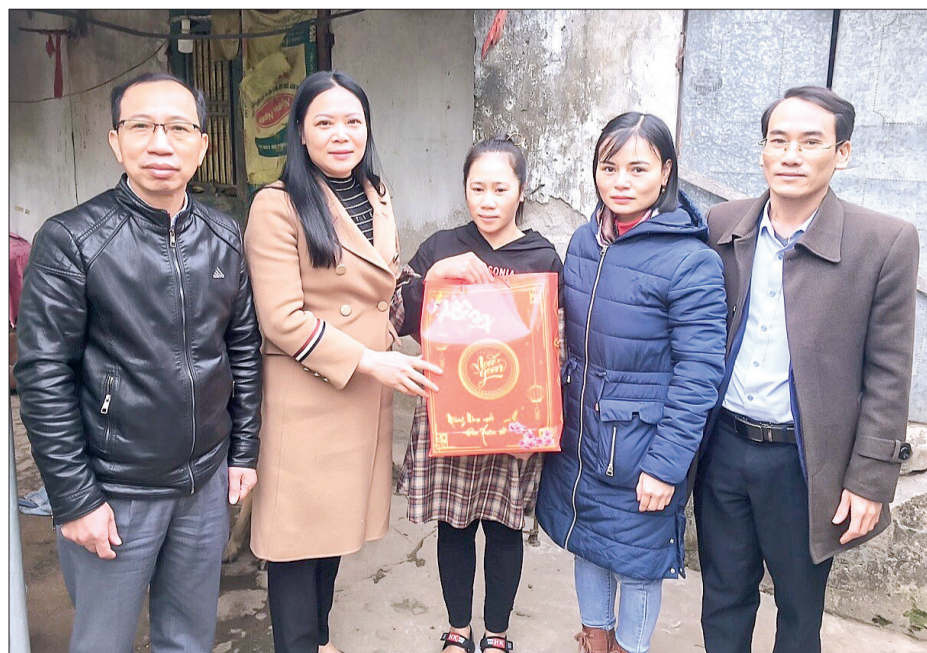
Lãnh đạo huyện Vũ Thư trao quà tết cho công nhân lao động có hoàn cảnh khó khăn.

Với phương châm "Ở đâu có công nhân khó, ở đó có tổ chức công đoàn", không để công nhân nào khó khăn mà không có tết, trong dịp tết Nguyên đán Quý Mão 2023, Liên đoàn Lao động huyện Vũ Thư tổ chức trao 639 suất quà cho công nhân lao động ở 153 công đoàn cơ sở, trong đó 232 suất quà cho công nhân lao động có hoàn cảnh đặc biệt khó khăn, mỗi suất trị giá 1,3 triệu đồng; 407 suất quà cho công nhân lao động có hoàn cảnh khó khăn, mỗi suất trị giá 800.000 đồng.